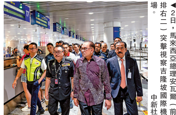
▲2日，馬來西亞總理安瓦爾（前排右二）突擊視察吉隆坡國際機場。