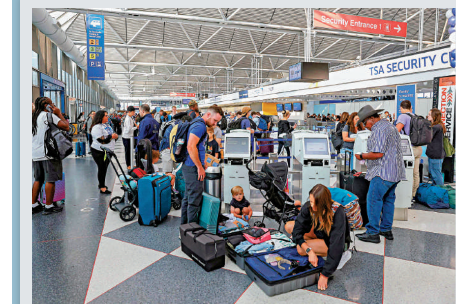
▲美國獨立日假期的遊客人數或創下新高，圖為遊客6月30日在伊利諾伊州的機場整理行李。

包括西南航空、阿拉斯加航空及邊疆航空等美國航空公司表示，他們所有的飛機都已經安裝防止