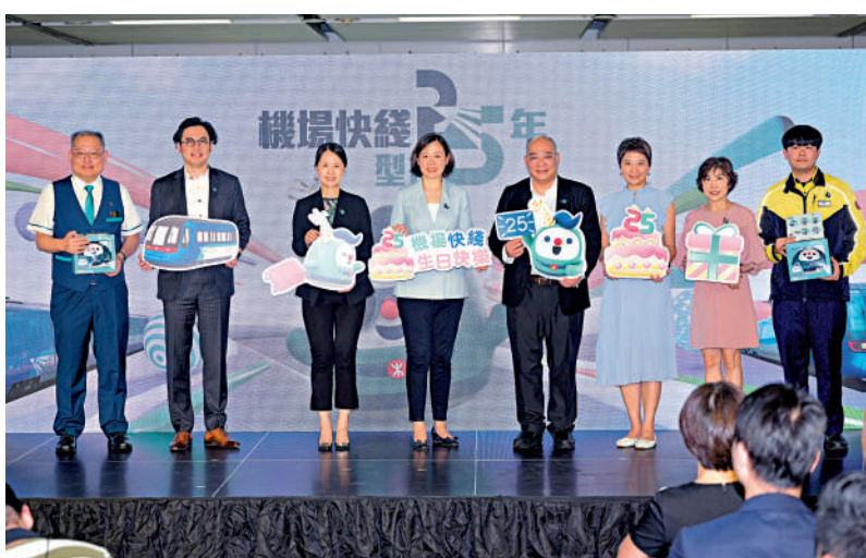
▲港鐵宣布送出7.5萬張機場快綫單程票，慶祝機場快綫投入服務25周年。

港鐵宣布明日起重開國泰航空在香港站的市區預辦登機服務，服務時間為每日上午6時至下午3時，而九龍站預辦登機服務仍暫停，港鐵表示將與相關航空公司商討其市區預辦登機服務重啟的安排。