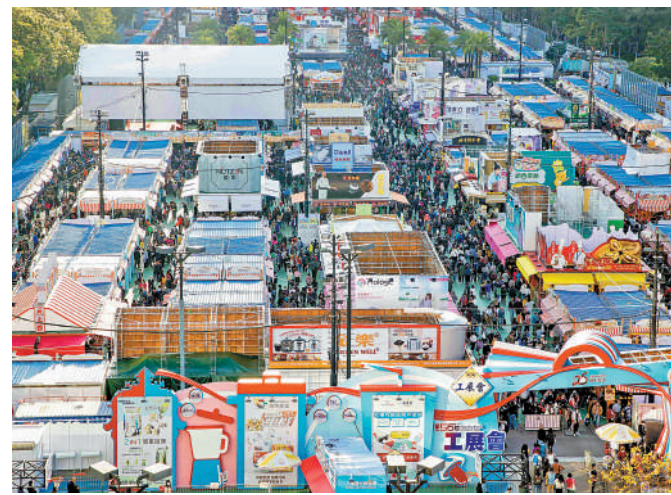
▲工展會過往甚受市民歡迎，會場人山人海。