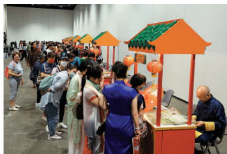
▲「香港情懷」嘉年華現場，吸引大批市民參與。