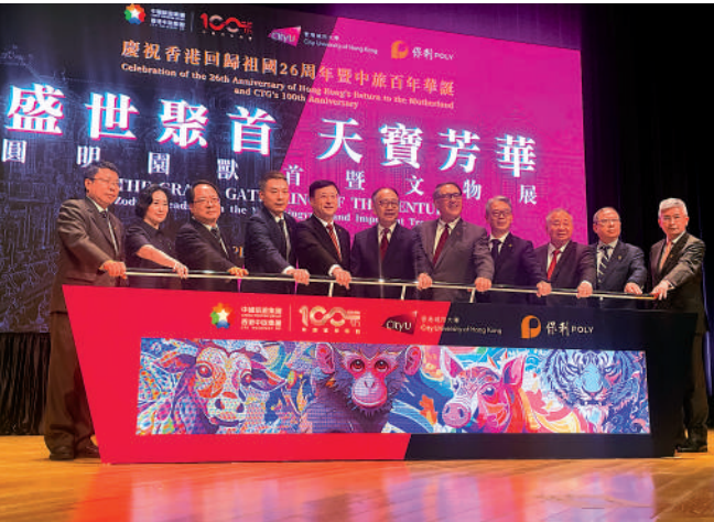
▲主禮嘉賓合影。