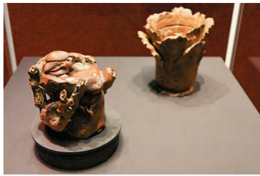
▲「濮澄款松樹紋壺」（前）、「封錫爵款白菜式筆筒」（後）。 中新社