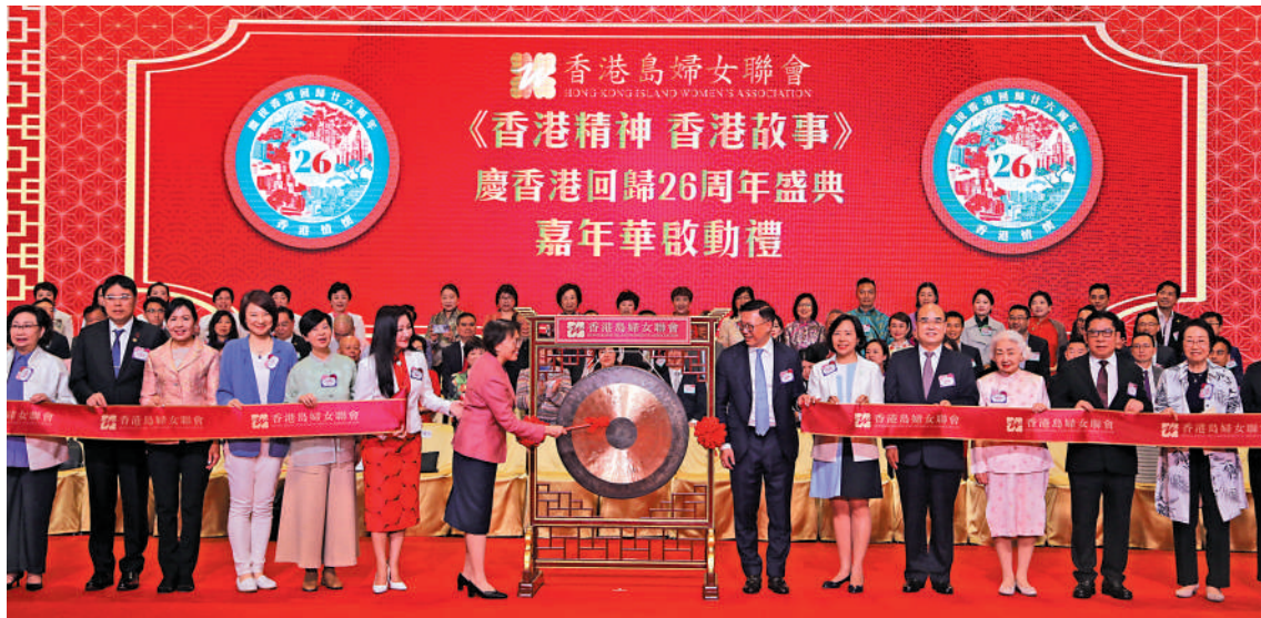
▲嘉賓出席「香港精神 香港故事——慶祝香港回歸26周年盛典」活動啟動禮。

【大公報訊】記者劉毅報道：為慶祝香港回歸祖國26周年，香港島婦女聯會昨日在香港會展中心舉行「香港精神 香港故事——慶祝香港回歸26周年盛典」活動啟動禮，通過全日舉行的「香港情懷」嘉年華及晚上的「香港故事」音樂會，展示中華文化在香港社會的源遠流長及獨特魅力，將中國傳統文化與市民愛國愛港情懷相結合，展現香港的奮鬥精神。