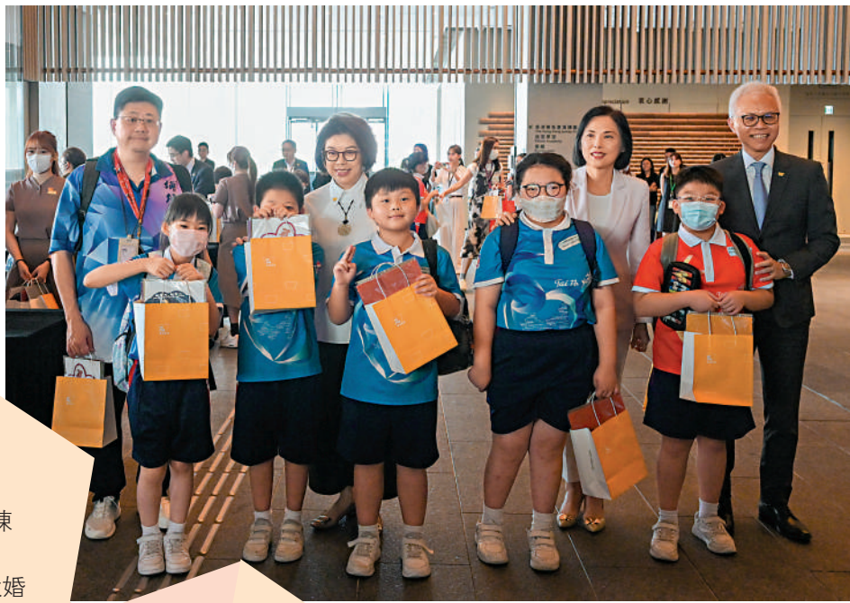
▲博物館向首100名入場訪客贈送博物館文創精品。