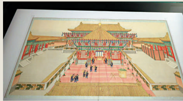
▲「交泰殿陳設冊寶圖」。