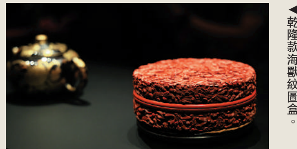
▲乾隆款海獸紋圖盒。