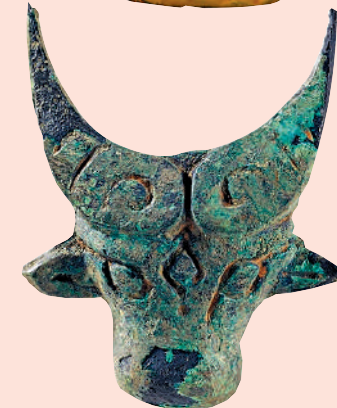
▲金沙遺址出土大量的金器和青銅器，現時金沙遺址博物館就收藏了高周大金面具和銅牛首等珍貴文物。

使得日本政客立心不良，要消滅殷商史實的謊言，不攻自破。無疑，舉世重視的金沙遺址出土，是中華文化精神遠源有力的傳揚，是天地不絕。