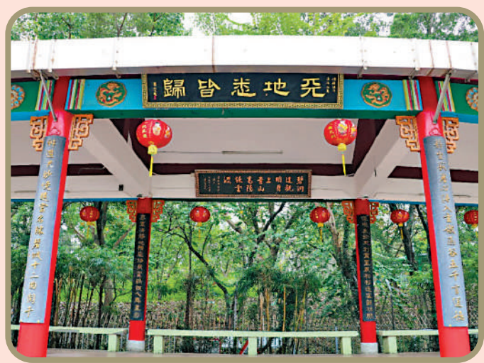
▲青松觀依園而建的長廊上，掛滿對聯，值得細賞。

樣。「碧城十二曲闌干」，承上總結，指品題名勝，就應像李商隱（約813-約858）學仙玉陽山時，品題道觀而寫出「碧城十二曲闌干」的名句。李商隱有《碧城》詩三首，寫道觀的幽深雅潔。「碧城十二曲闌干」是第一首的首句。