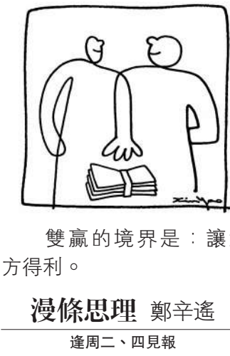
雙贏的境界是：讓對方得利。 漫條思理 鄭辛遙 逢周二、四見報

淡妝流行，過去幾年的疫情，令不少女士從一向習慣性的濃妝，變得把妝容淡化起來。雖然今天一切已回復過來，臉上妝容總算是完全讓你可以自由選擇，淡妝艷抹兩相宜，有人喜歡像往日般化一個精緻的美妝，也有人喜歡維持那淡淡的妝容。 一件漂亮的晚裝，穿在一位美麗女士的身上，但如果臉上沒有一點妝容襯托，就會顯得有點失色，就如擁有一個好劇本，也需要有好演員去配合演出。美妝在某些場合中，的確是有一定功用的。 不過，無論是濃妝也好、淡妝也好，美容是講求技術的，也是一門學問，否則也就不會有那麼多美容院開設。作為自身美容的第一步，當然是選擇一系列適當的護膚品，擁有健康的膚質，煥發神采，是基本美妝程序重要的一環。 其實，所謂淡妝，不等於「零美妝」，只是如何化一個被稱為「偽素顏」的妝容，意思是美妝後給別人的感覺像沒化妝一般。這是極講求技巧的，是真正美妝技術的表現，越簡單越要運用適當的方法。季初各大美妝