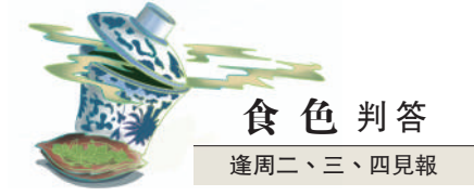
食色判答 逢周二、三、四見報