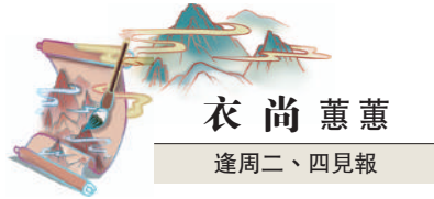
衣尚蕙蕙 逢周二、四見報