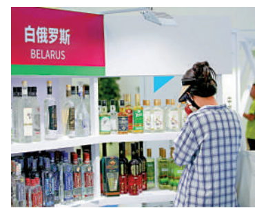
6月16日，民眾在2023上合國際投資貿易博覽會白俄羅斯展區挑選酒水。

在上合峰會召開前夕，印度傳出則重要消息。據外媒報道，印度石油公司自今年6月開始，已經使用人民幣購買俄羅斯石油。此前，中俄今年3月簽署了2030年前雙方經濟合作的聯合聲明，提出在雙邊貿易和投資中穩步提升本幣結算比重。有分析指出，預期上合組織在推動人民幣國際化方面，將扮演重要角色。