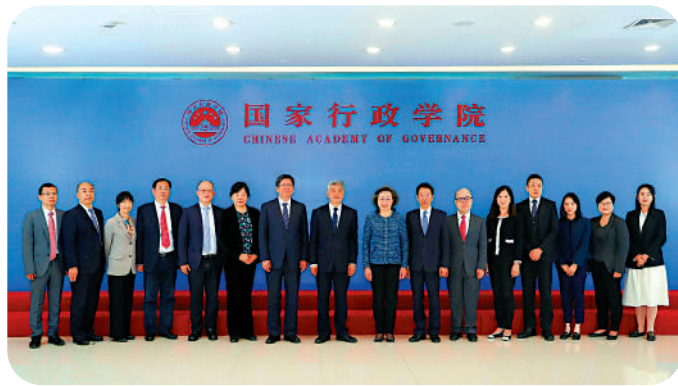
▲公務員事務局局長楊何蓓茵今年4月率團到北京，其間曾到國家行政學院訪問。