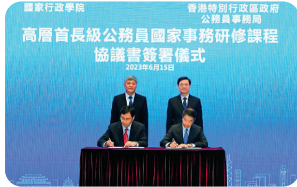
▲公務員事務局與國家行政學院國際和港澳培訓中心早前簽署首長級公務員國家事務研修課程的協議書。