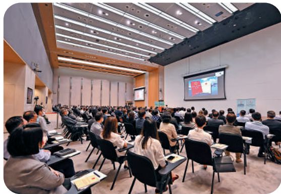
▲公務員事務局為公務員舉辦憲法與基本法系列講座。