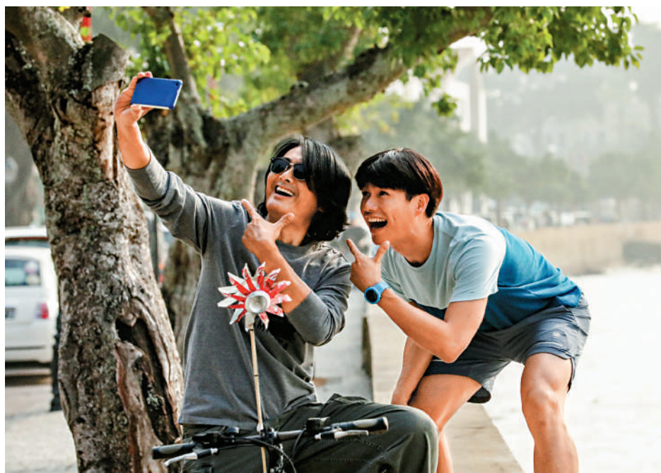
周潤發（左）與柯煒林在電影《別叫我「賭神」》中飾演父子。