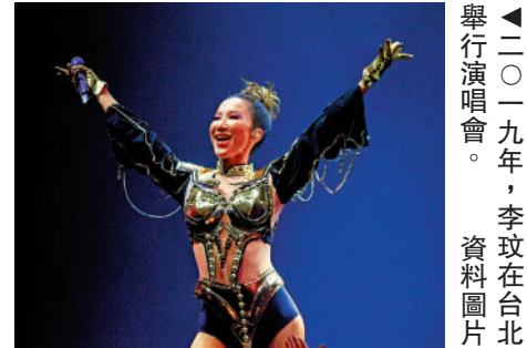
二〇一九年，李玟在台北舉行演唱會。

梁漢文：知道消息好震驚，因為睇住佢入行，我哋曾經合作過……聽到呢個消息當然係好唔開心。想念你的一切CoCo，希望佢家人及愛佢嘅所有朋友節哀順變。