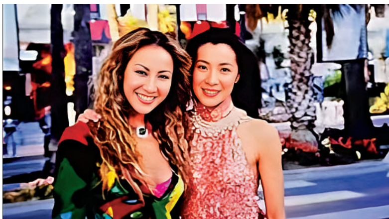
李玟（左）與楊紫瓊當年聯袂出席美國奧斯卡頒獎禮。