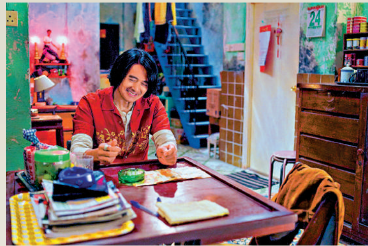
周潤發在新片中飾演爛賭爸爸。