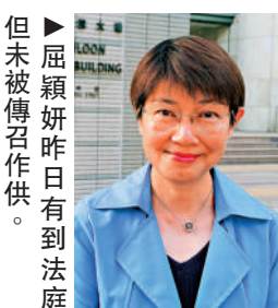
但未被傳召作供。