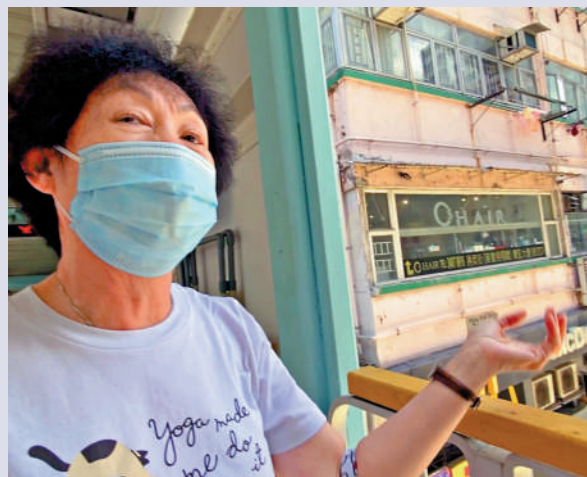
▲蘇女士被掉落的石屎碎塊割傷小腿，她慶幸「執返條命」，自行貼上膠布。