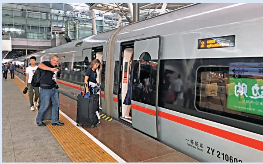
▲旅客在廣州南站搭乘高鐵。

【大公報訊】記者方俊明廣州報道：隨著粵港澳大灣區高鐵網不斷完善，灣區活力進一步激活。記者5日從廣鐵相關部門獲悉，繼贛深高鐵通車、廣東邁入「市市通高鐵」之後，廣東在全國可望率先實現「市市通時速350高鐵」。其中，廣汕高鐵最快今年9月開通，廣湛高鐵擬明年通車，灣區高鐵網延伸貫通粵東、粵西地區。據最新規劃，到2025年，廣東高鐵路里程將佔到全省鐵路超53%，將實現廣州與灣區各市1小時通達，與省內其他地級城市間2小時內通達，與鄰近省會城市3小時內通達。