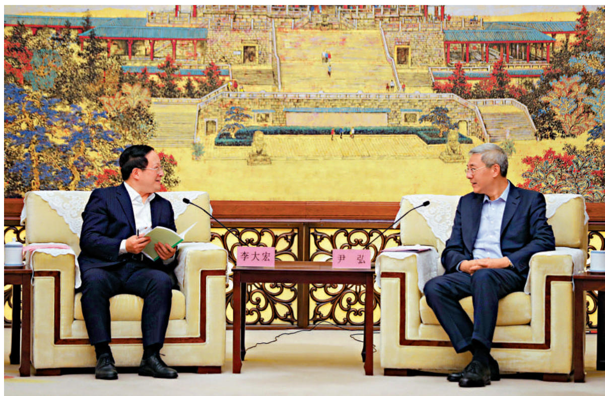
▲江西省委書記尹弘（右）會見2023「范長江行動——香港傳媒學子江西行」採訪團團長、香港大公文匯傳媒集團董事長、總編輯兼文匯報社社長、大公報社社長李大宏（左）。

江西省委常委、宣傳部部長莊兆林，江西省委常委、秘書長史文斌，江西省委宣傳部副部長傅雲，江西省委教育工委書記、省教育廳廳長吳永明，江西省外辦（省港澳事務辦）黨組書記、主任范勇，2023「范長江行動——香港傳媒學子江西行」採訪團副團長、香港大公文匯傳媒集團駐江西辦事處主任王逍參加會見。