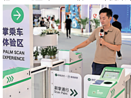
▲4日，媒體記者在2023全球數字經濟大會體驗微信刷掌乘車。

在數字技術與產業方面，白皮書指出，截至2023年5月，95個國家（地區）的256家網絡運營商提供商用5G服務，全球5G人口覆蓋率約30.6%；中國建成5G基站264.6萬個，佔全球超過60%；全球5G用戶達到11.5億，中國佔58%。全球5G創新應用中產業數字化佔比達60.5%，其中工業互聯網融合應用達29.4%。同時，2022年，全球人工智能產業規模4500億美元，同比增長17.3%。