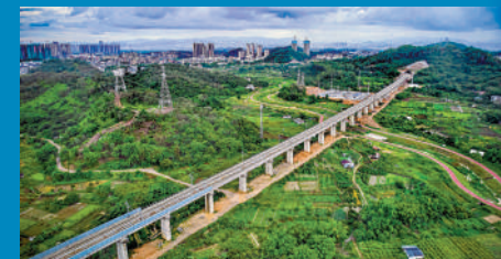
▲廣汕高鐵路最快9月開通。圖為在建中的廣汕高鐵路。