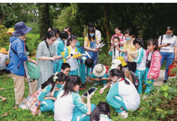
▲第四屆粵港澳自然教育觀察大賽。

是「2023年中國自然教育大會」一大特色。大會期間，將邀請約100名優秀粵港澳青年代表現場參會，為中國自然教育的共融發展做出示範性表率；同步舉行2023「一起向自然」展覽*粵港澳自然教育嘉年華，分主題、分時間段設置50到80個展位，展示粵港澳自然教育的活力與創新風采。