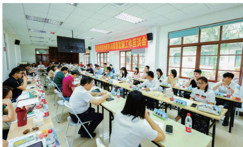
▲粵港澳自然教育高質量發展工作座談會。

「2023年中國自然教育大會」7月7日至9日在廣州舉辦，以「人與自然和諧共生——中國式現代化中的自然教育」為主題，來自粵港澳三地政府部門、社會機構代表，專家學者，自然教育從業者和粵港澳青年等逾1200人參與。在粵港澳自然教育近年展現蓬勃生機下，大會將作為三地自然教育合作新起點，並通過「自然教育+」跨界融合、協同發展，踐行人與自然和諧共生的自然教育發展方向，以自然教育為景觀建築、旅遊、教育、戶外拓展、健身、營地等傳統行業轉型發展注入新活力，推進產業融合升級，實現跨越發展。