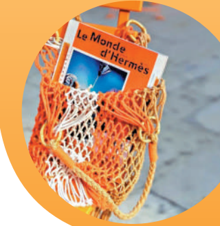
▲Hermès快閃書報亭，引發年輕人領取。