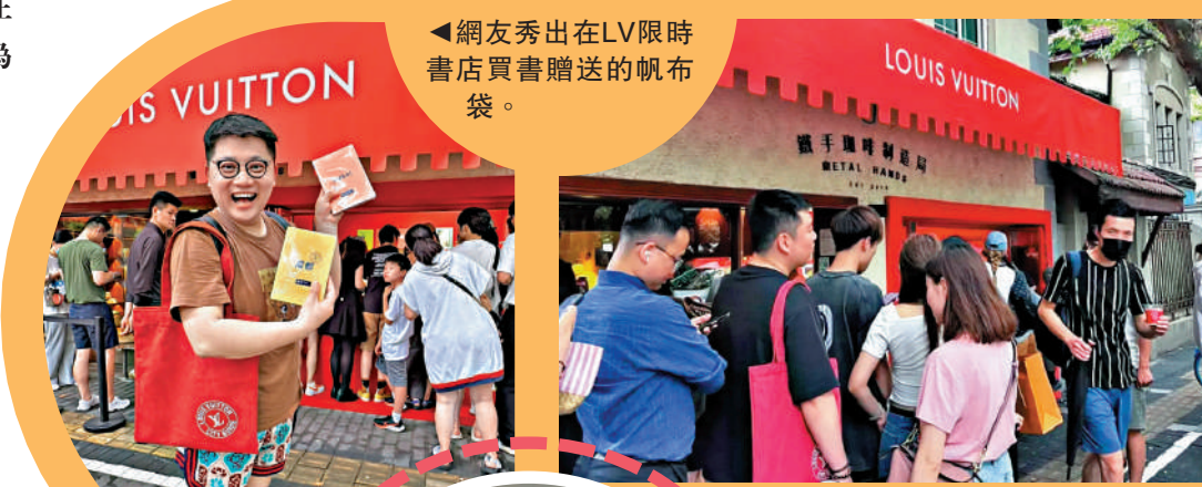
▲網友秀出在LV限時書店買書贈送的帆布袋。