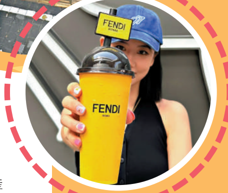
▲網友在社交平台晒出Fendi聯名的喜茶。