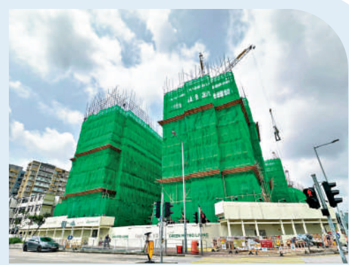
▲滙都I預計於2025年6月入伙。