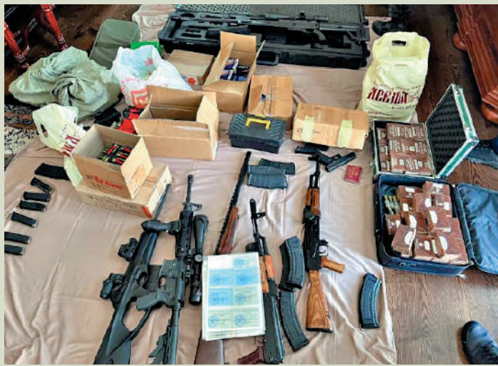
▲俄當局在普里戈任的住所找到大量槍支彈藥。