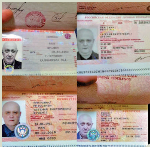
▲幾本不同化名的護照。