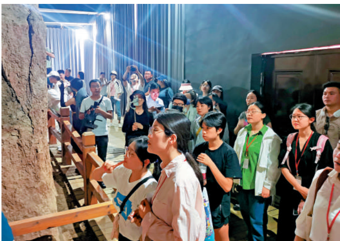
◀同學們近距離觀察仰韶文化斷壁，感受考古魅力。