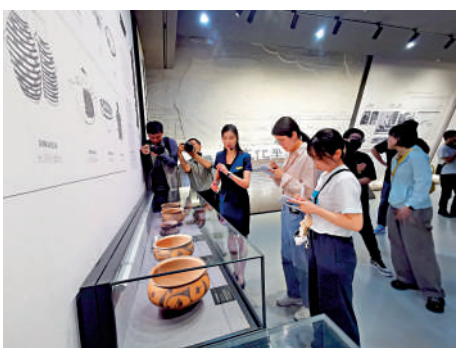
▲學子們認真聆聽講解員介紹館內文物。

展廳裏還有一處未經發掘的仰韶遺址斷壁，上面有一塊空缺。講解員講述，一次下雨使得土層發生了坍塌，而這次坍塌意外地出土了一件罕見的完整彩陶器皿。「或許這就是考古的魅力。」范佳琦坦言。