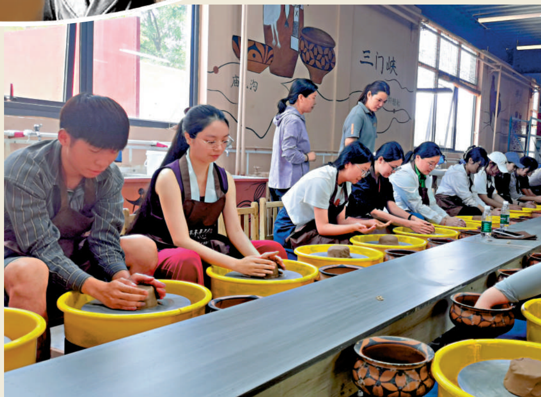
▲6月30日，「2023范長江行動中原行」豫港學子在河南省三門峽澠池縣走近仰韶文化，體驗陶器的製作。