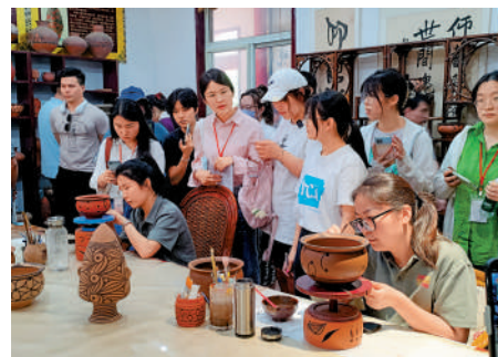
▲同學們細心觀看工作人員在陶器上繪製圖案。