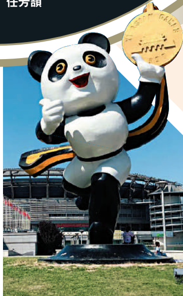
◀亞運吉祥物選了「國寶」大熊貓，名叫「盼盼」。