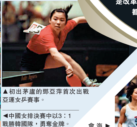
▲初出茅廬的鄧亞萍首次出戰亞運女乒賽事。