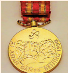
▶金牌圖案是萬里長城。

本屆7次刷新世界紀錄，89人次打破亞洲紀錄，189次改寫亞運會紀錄。如此大面積地刷新紀錄，在亞運史上罕見，預示亞洲體育運動將成為世界體壇不容忽視的力量。而中國成功地舉辦了亞運會，也成功地讓全世界進一步了解了亞洲。10月7日的閉幕式上，沙特阿拉伯代表團打出「謝謝你中國」的橫幅，孟加拉代表團打出「中孟友誼萬歲」的標語。