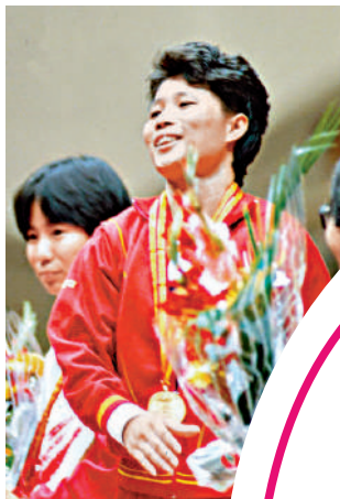
▲中國舉重選手邢芬勇奪北京亞運的首面金牌。