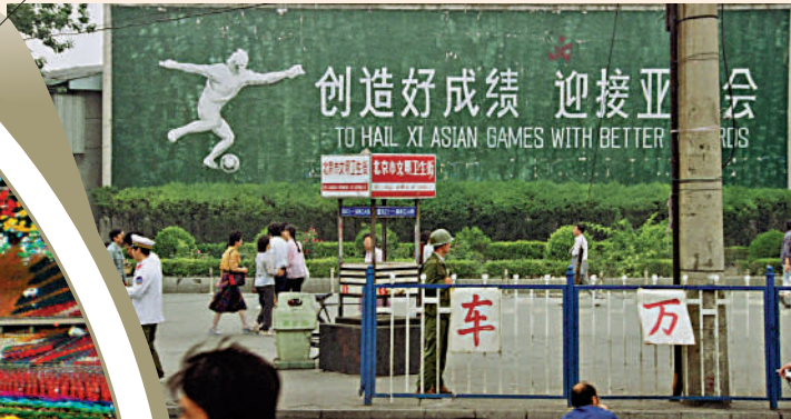
▲為了辦好亞運，北京在城內興建大量立交橋及寬敞的馬路。

在20世紀90年代，大型體育賽事對舉辦國家的要求並不僅僅停留在基礎設施上，電子服務系統等先進技術也應滿足相應需求。彼時，我國「改革開放」政策已提出十餘年，科技領域突飛猛進，擁有舉辦大型賽事要求的科技實力。為辦好亞運會，中國從1986年起，開始興建20個新建場館，改建或修繕原有場館13座，並在北京四環道外興建奧林匹克中心和亞運村。鄧小平同志視察國家奧林匹克體育中心時，對亞運會體育場十分滿意，十分幽默地說了句：「中國的月亮可能比外國的圓一點」。