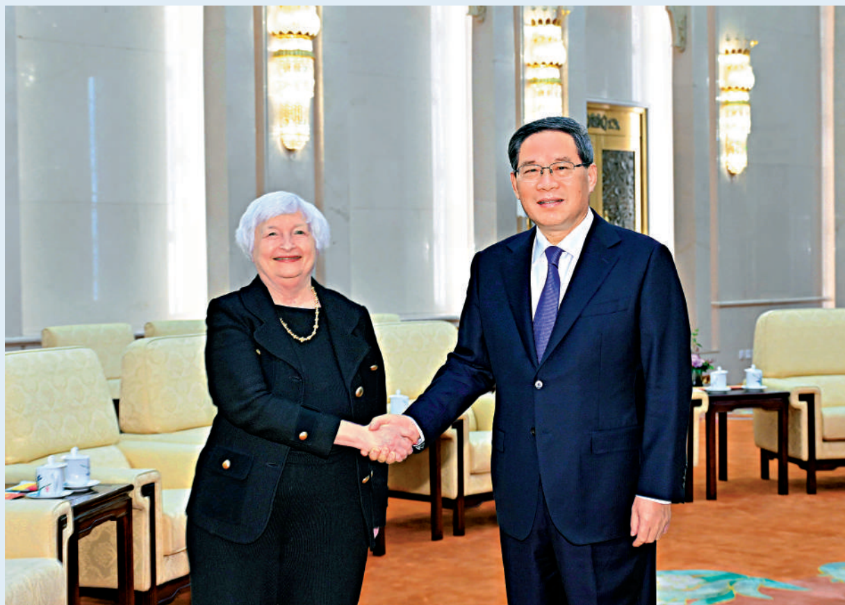
▲7月7日下午，國務院總理李強（右）在北京人民大會堂會見美國財政部長耶倫。

【大公報訊】綜合新華社、中通社報道：國務院總理李強7月7日下午在人民大會堂會見美國財政部長耶倫。李強指出，中美經濟利益緊密交融，互利共贏是中美經濟關係的本質，加強合作是雙方的現實需求和正確選擇。雙方應通過坦誠、深入、務實交流，就雙邊經濟領域的重要問題加強溝通、尋求共識，為中美經濟關係注入穩定性和正能量。耶倫表示，美方不尋求「脫鈎斷鏈」，願同中方在穩定宏觀經濟、應對全球性挑戰方面加強合作，尋求美中經濟互利雙贏。