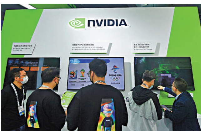
▲在2023年阿里雲雲棲大會上，參觀者在美國半導體公司NVIDIA的展位前了解產品。

維。單極霸權不得人心，集團對抗沒有前途，「小院高牆」封閉退步，「脫鈎斷鏈」損人害己，把中國當作假想敵，是典型的過度焦慮。美方與其說一套、做一套，在對華遏制打壓的所謂「三分法」「三點論」上翻新做文章，不如把精力真正放在踐行相互尊重、和平共處、合作共贏「三原則」上，與中方相向而行，共同推動中美關係重返正軌。