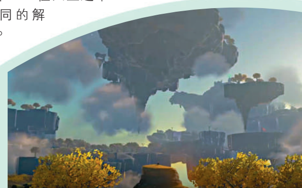
▶遊戲的畫面依然與上一代作品近似，有着油畫般的質感。

除了上面提到的新特性外，遊戲世界也大大拓展了。天空上的空島不僅有地上少見的各種「左納烏設備」，還有許多地上難以見到的植物。地下的地底世界則是一個陰森隱秘的全新世界，與地面上的海拉魯大地大小完全相同，地上有神廟的地方，地底是破魔之根，地上是山峰，地下則會是山谷。地底的世界與地面的光明不同，是伸手不見五指的黑暗世界，需要玩家用各種手段照明，才可以進行探險。遊戲也為玩家講述了一個嶄新的劇情故事，但由於遊戲可探索的內容實在太多，已然無暇顧及劇情。經過這幾周的體驗，如果想想以RPG遊戲的模式，線性的體驗這款遊戲幾乎是不可能的。因為在探索主線劇情的同時，玩家一定會被各式各樣有趣的事件分散注意力，更加沉浸在精彩的遊戲世界中。一位「沉迷」這款遊戲的朋友就直言，如果你對於某一個遊戲事件想到了一個解法，那一定不是唯一，任天堂還準備了10種不同的解法，等你探索。