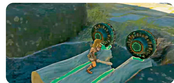
◀用風扇加木頭製作出小竹筐是遊戲的「基本操作」。