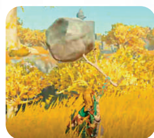
▶用樹枝加石頭，就能打出最簡單的武器。

技能「餘料建造」同樣來自勞魯的手臂，這個技能可以將遊戲中的物品組合到自己的武器與盾、箭上，也允許玩家再把兩把武器拼裝起來，可以利用這個功能增加武器的攻擊力、用途和特性，同時還可使武器耐久度重置。如果說「究極手」是給玩家的建造提供了無限可能，那麼「餘料建造」就給戰鬥提供了無限可能。同樣以剛剛提到的「左納烏」為例，如果在武器上裝上消防栓，武器就能夠噴水，如果在武器上裝上風扇，能把重量較輕的敵人吹飛，而如果在盾牌上加上鏡子，甚至能「閃瞎」敵人。任天堂貼心地為各式各樣的武器都設計了不同的動畫，也給了玩家獨特的體驗。