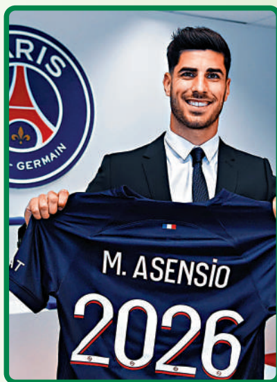
▶阿辛斯奧(右二)自由身離開皇馬。