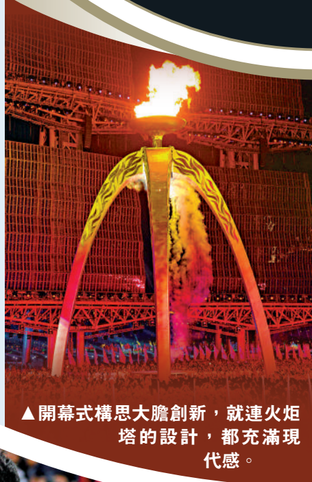
▲開幕式構思大膽創新，就連火炬塔的設計，都充滿現代感。

加上其間實施的工業污染控制、城市控煙、光亮工程等，廣州實現了「路更寬、天更藍、水更清、房更靚、城更美」的目標，奠定並加速邁向國際化大都市和打造世界體育名城的步伐。