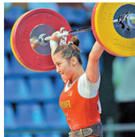
▲中國舉重選手李萍打破抓舉和總成績兩項世界紀錄。