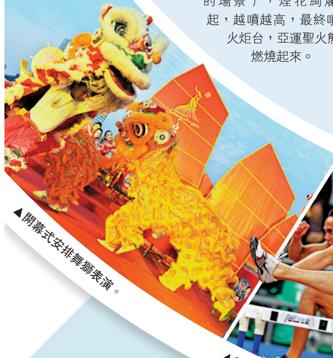
▲開幕式安排舞獅表演。

開幕式極具中國風格、嶺南特色，啟幕即以「水」開篇，之後，木棉花、紅頭船、遠航的船、粵語兒歌等陸續以不同形式出現，展現了廣和廣州的水文化、花文化、絲路文化、僑文化、音樂文化等各類嶺南文化。點火環節同樣「中國式」。奧運跳水冠軍何冲手舉火炬跑到火炬台前，「茫然」時，一對男女女孩出現，把他帶到一個放着中國炮仗禮花的火炬台下方。何冲點燃炮仗，男孩女孩捂住耳朵（模擬放鞭炮的場景），煙花絢爛燃起，越噴越高，最終噴到火炬台，亞運聖火熊熊燃燒起來。