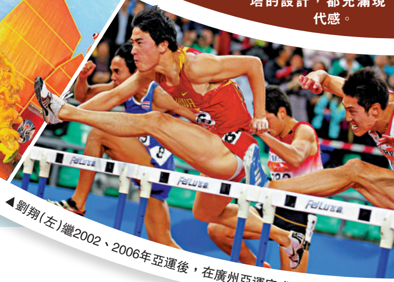
▲劉翔（左）繼2002、2006年亞運後，在廣州亞運完成100米欄3連霸。