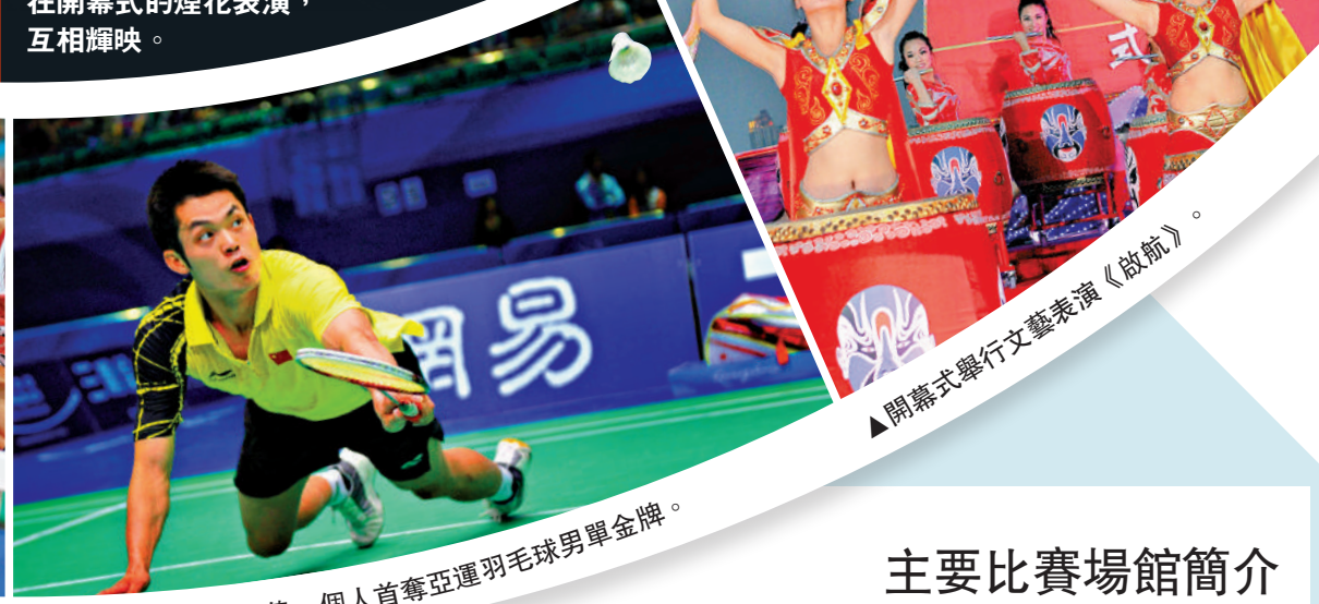
▲林丹決賽擊敗李宗偉，個人首奪亞運羽毛球男單金牌。