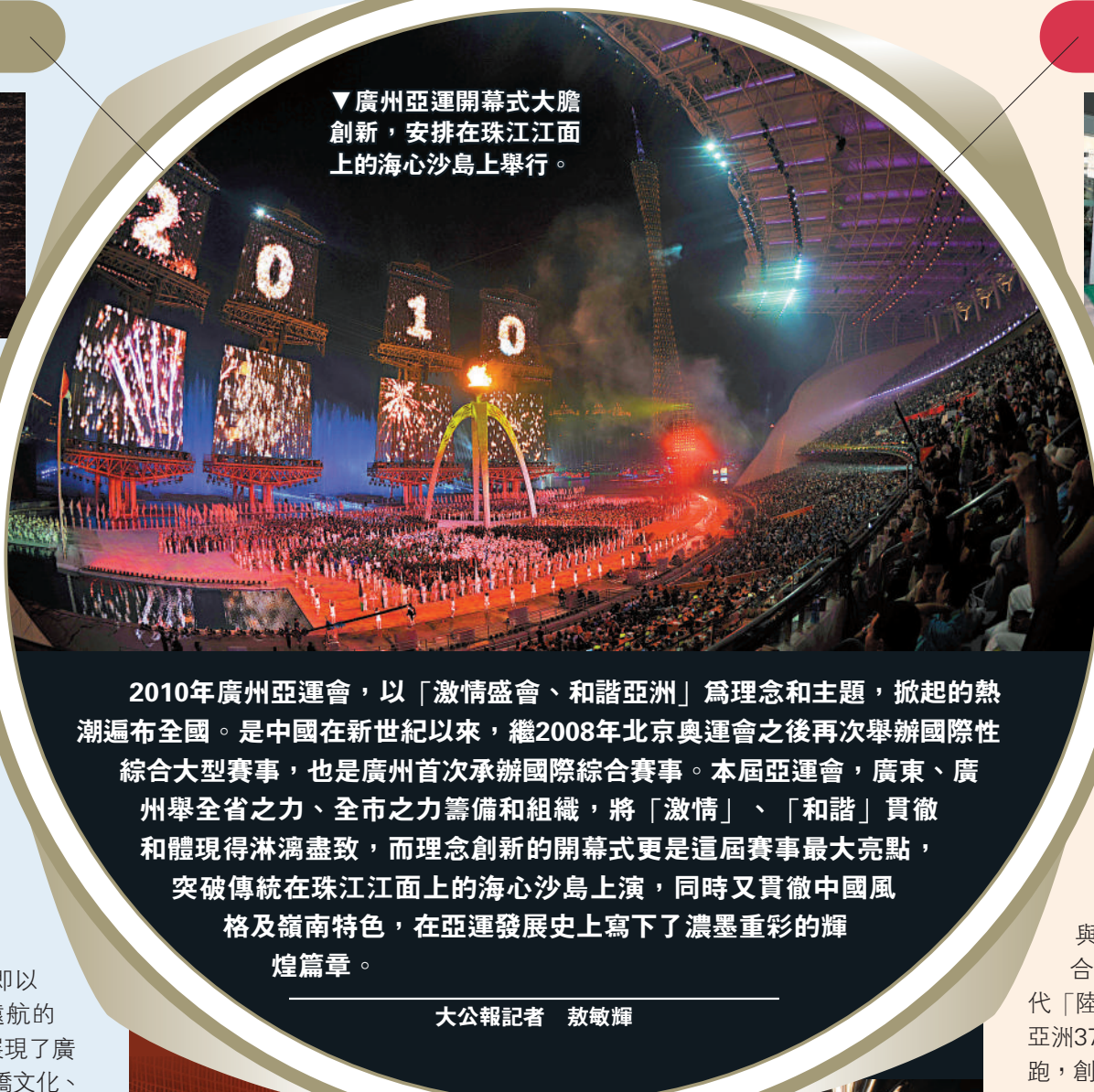
▼廣州亞運開幕式大膽創新，安排在珠江江面上的海心沙島上舉行。

2010年廣州亞運會，以「激情盛會、和諧亞洲」為理念和主題，掀起的熱潮遍布全國。是中國在新世紀以來，繼2008年北京奧運會之後再次舉辦國際性綜合大型賽事，也是廣州首次承辦國際綜合賽事。本屆亞運會，廣東、廣州舉全省之力、全市之力籌備和組織，將「激情」、「和諧」貫徹和體現得淋漓盡致，而理念創新的開幕式更是這屆賽事最大亮點，突破傳統在珠江江面上的海心沙島上演，同時又貫徹中國風格及嶺南特色，在亞運發展史上寫下了濃墨重彩的輝煌篇章。