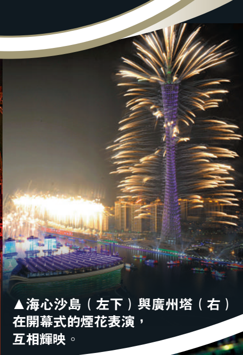
▲海心沙島（左下）與廣州塔（右）在開幕式的煙花表演，互相輝映。