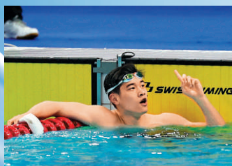
▲潘展樂在全國冠軍賽比賽到達終點後觀看成績。