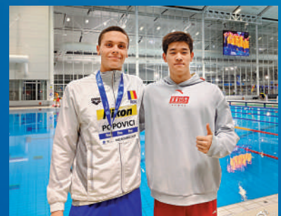
▲波波維奇（左）是潘展樂追趕的目標。

羅馬尼亞天才少年波波維奇，是潘展樂目前追趕的最大目標。前者在年齡上比潘展樂還小一個月，但他已是男子短距離自由泳項目的世界冠軍，並在去年的歐錦賽上，