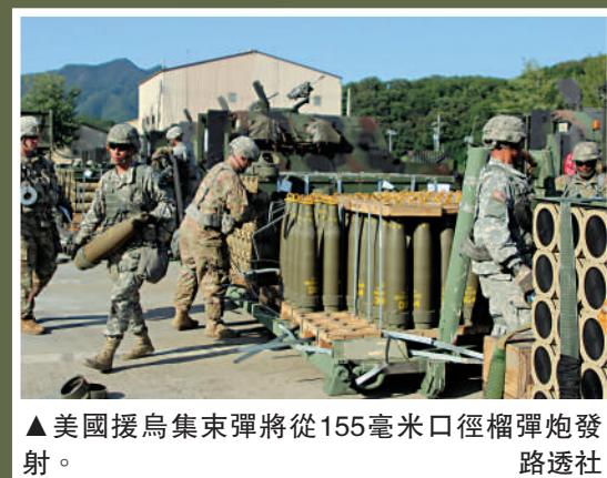
▲美國援烏集束彈將從155毫米口徑榴彈炮發射。

俄羅斯駐美大使安東諾夫8日稱，美國的挑釁程度「超出極限」，使人類更接近新的世界大戰。美國向烏克蘭提供致命武器的舉動，殘忍和無恥到令人震驚。