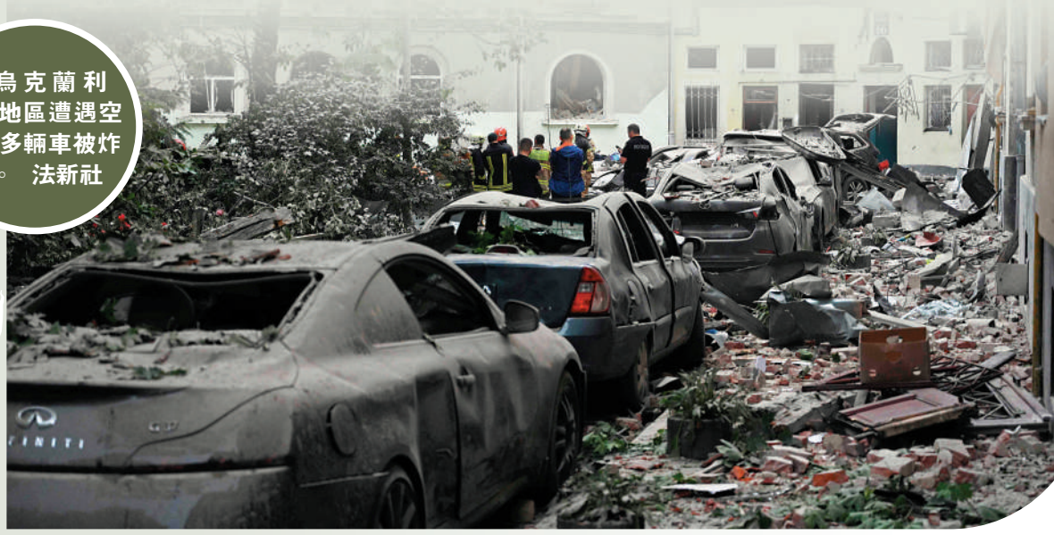
►烏克蘭利沃夫地區遭遇空襲，多輛車被炸毀。