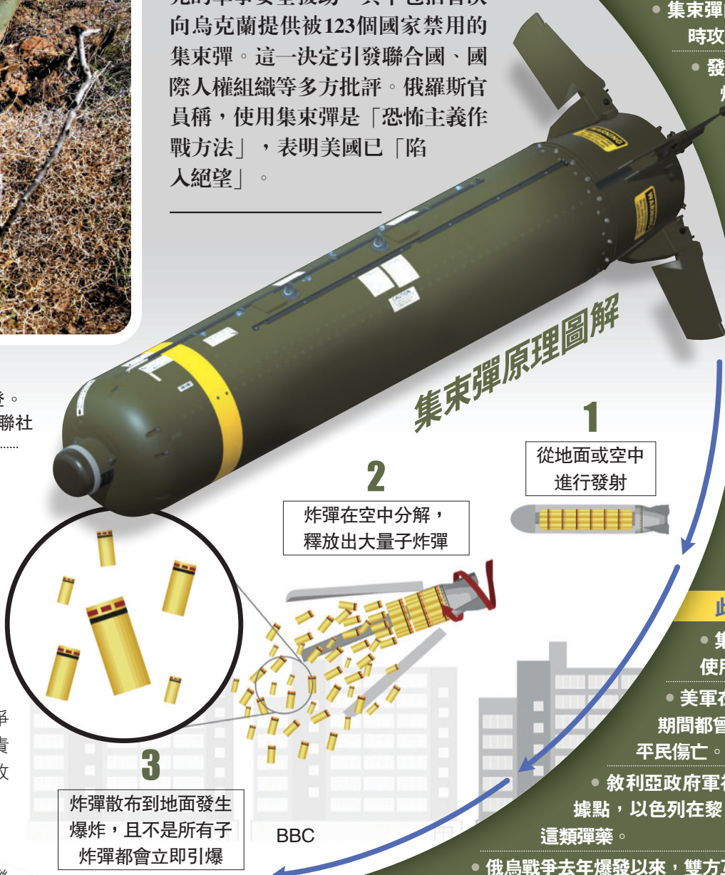
黎巴嫩戰場上的集束彈裝置。

經美國總統拜登同意，美國國防部政策副部長卡爾7日透露，美國最新的8億美元烏克蘭軍援計劃將提供額外的火炮系統和彈藥，包括集束彈，它們將從北約提供的155毫米口徑榴彈炮發射，適用於打擊俄軍裝甲力量。五角大樓沒有指明具體提供的數量，《華郵》稱美國現庫存「數百萬發」集束彈。