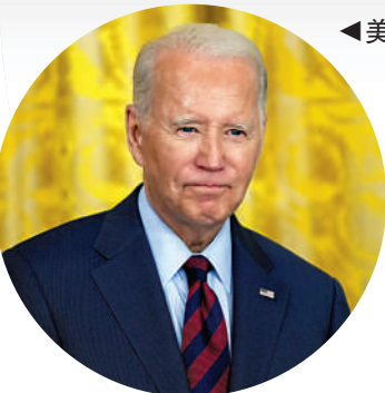
美國總統拜登。

聞秘書普薩基在被問及俄羅斯使用包括集束炸彈在內的非常規武器時稱，「如果這是真的，這可能會構成戰爭罪」。外媒指出，美國政府不顧多方譴責堅持提供集束彈的做法，證明烏克蘭反攻戰況不如預期。