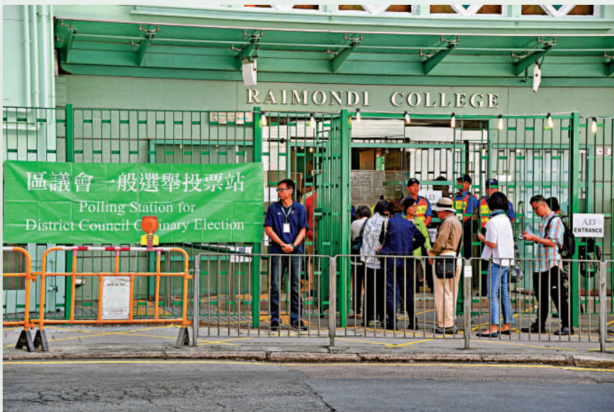
▲區議會改革工作完成，未來可回歸服務市民的初心。

李家超在社交平台發文表示，現屆區議會自2020年起，有大量區議員作出違反區議會職能的行為，破壞會議進行，粗暴地做出不符區議會作為地區諮詢組織職能的事情，更有涉嫌違法行為，危害國家安全。這些亂象是對香港的一響警鐘。特區政府必須在制度上堵塞漏洞，把反中亂港分子完全排除於區議會之外。為此，特區政府早前公布完善地區治理建議方案，旨在重塑區議會，讓區議會可回復到《基本法》第97條下的定位，同時從根本完善地區治理架構，增強地區治理效能。政府之後向立法會提交《條例草案》，以落實重塑區議會的相關立法工作。