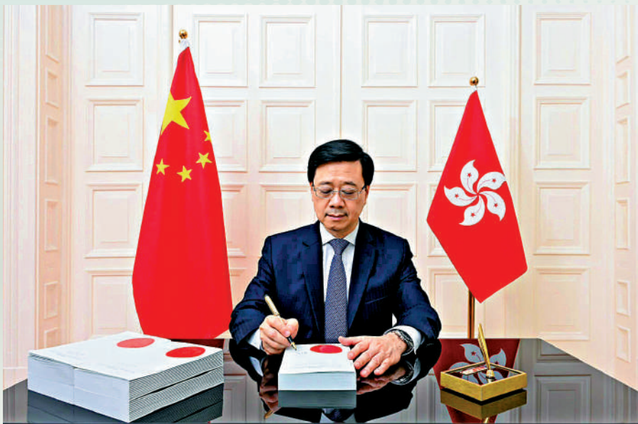
▲李家超簽署立法會日前通過的《2023年區議會（修訂）條例》。