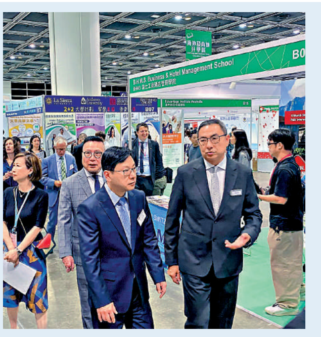
▲孫玉菡昨日出席第29屆國際教育及職業展。