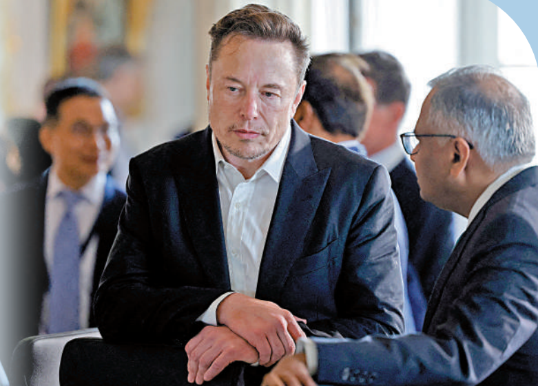
▶馬斯克旗下公司日前向Wachtell律師事務所提起訴訟。