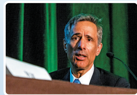
▲Wachtell律師事務所的薩維特是推特收購案中的核心人物。