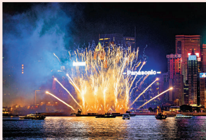
▲在維港美景下欣賞「幻彩詠香江」水上煙火，感覺截然不同。