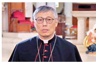
▲天主教香港教區主教周守仁獲擢升為樞機，任命儀式於9月30日在梵蒂岡進行。

今年4月，周守仁應天主教北京教區李山主教的邀請率團前往北京，他是香港回歸以來首位訪京的在任香港教區主教。結束訪京行程之後，周守仁在教區刊物《公教報》表示，天主教教理肯定愛國的責任，教友有責任令