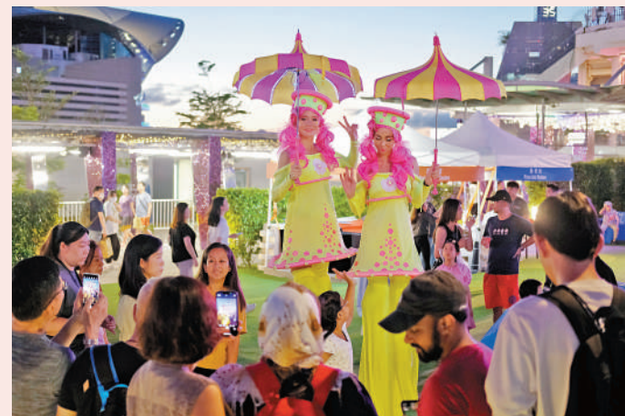
▲嘉年華有雙高蹺等特色街頭表演，吸引市民拍照。