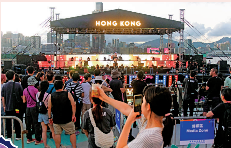
▲水上音樂會是嘉年華的重頭戲，現場尖叫及歡呼聲浪接浪。