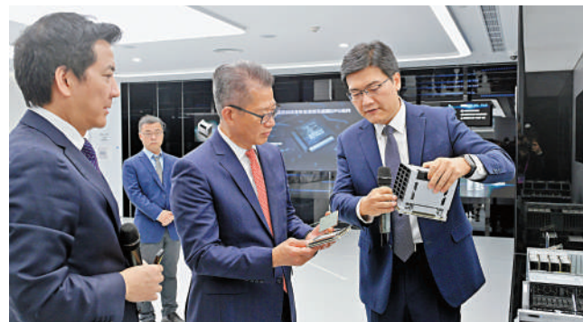
▲陳茂波日前到訪上海，並到當地企業參觀。

此外，陳茂波表示今年是滬港合作會議機制設立20周年，香港與上海分別在粵港澳大灣區和長三角城市群扮演重要角色，在很多範疇，例如金融、商貿、物流航運、綠色轉型、數字經濟、文化旅遊等，滬港都可以加強合作，共同為國家的高質量發展貢獻更大力量。