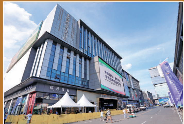
▲位於長沙高橋大市場的中非經貿合作創新示範範圍。