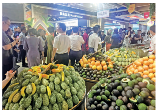
▲來自非洲的水果受到消費者的歡迎。

在疫情三年的阻隔之後，本屆中非經貿博覽會迎來了跨山越海而來的非洲客人和非洲商品、呈現更加火爆的人氣、展開了更加深入的交流，散發出「爆表」的合作熱力。走進長沙國際會展中心的展館，來自非洲大陸的咖啡、紅酒、水果……琳琅滿目，以及載歌載舞、熱情的非洲朋友，濃濃的非洲風情撲面而來。