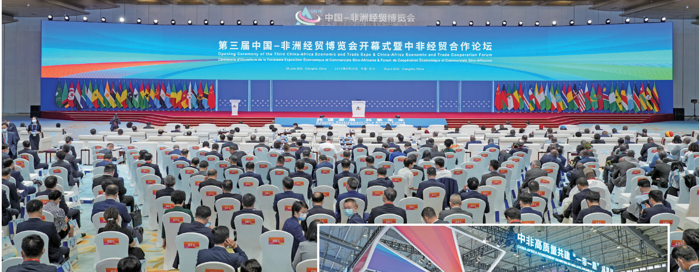
▲6月29日，第三屆中國-非洲經貿博覽會暨中非經貿合作論壇在長沙開幕。

進入盛夏的長沙陽光似火。6月29日至7月2日，一場比天氣更加熱烈的盛會——第三屆中非經貿博覽會在長沙隆重舉行。中非經貿博覽會是落實中非合作論壇經貿舉措的新平台，地方對非經貿合作的新窗口。該展會永久落戶湖南，每兩年舉辦一次。