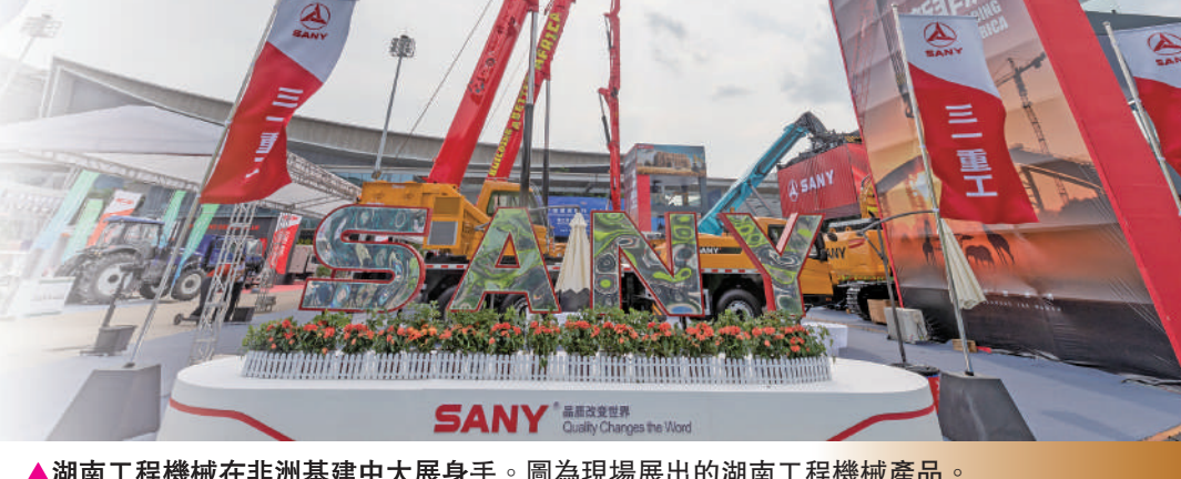
▲湖南工程機械在非洲基建中大展身手。圖為現場展出的湖南工程機械產品。

據悉，湖南14個州市會前赴28個非洲國家開展了經貿對接，會期開展對口洽談，構建起「會前有對接、會中有服務、會後有回訪」的常態化聯繫機制，在地方對非合作中作出示範。本次活動簽約項目120個、金額103億美元。發布99個對接合作項目、金額87億美元，其中11個非洲國家發布74個對接項目，數量為歷屆之最。