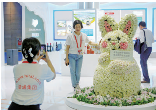
▲產自肯尼亞的鮮花，不到一天時間就能到達長沙消費者手裏。圖為展會現場由肯尼亞玫瑰拼成的兔子。

2002年，三一平地機出口摩洛哥，成為最早一批進入非洲市場的工程機械企業，這也是三一出口的第一台產品。當前，三一在非洲市場累計實現銷售收入近170億元、設備保有量超過18,000台，位列中國工程機械企業產品出口非洲的第一名。而近三年，三一集團在非洲銷售額年均複合增長率達到45.3%，累計對非銷售額突破60億元。