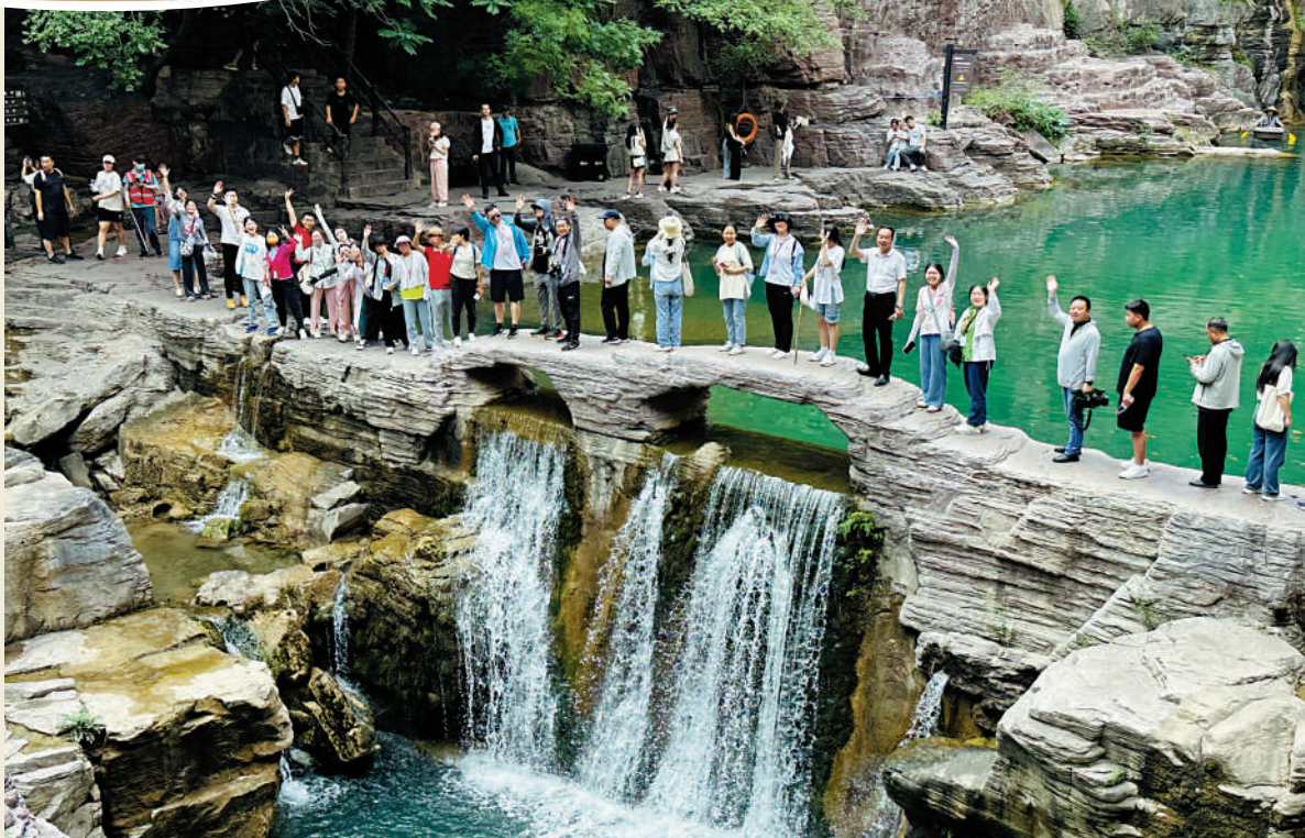
◀豫港學子們暢遊雲台山。