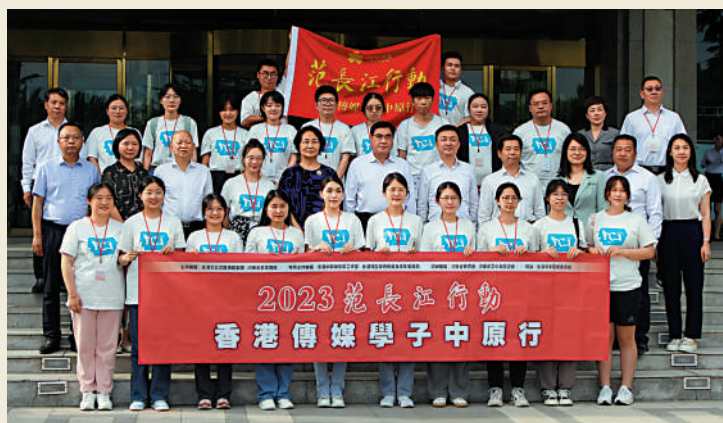
▶7月2日，「2023范長江行動·香港傳媒學子中原行」圓滿結束。