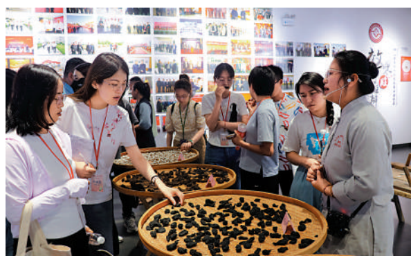
▶同學們參訪河南企業懷山堂。