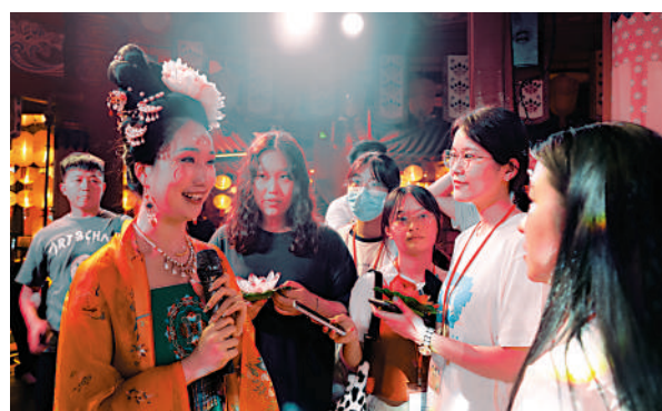
▶同學們在星河里·唐宮夜宴採訪演員。