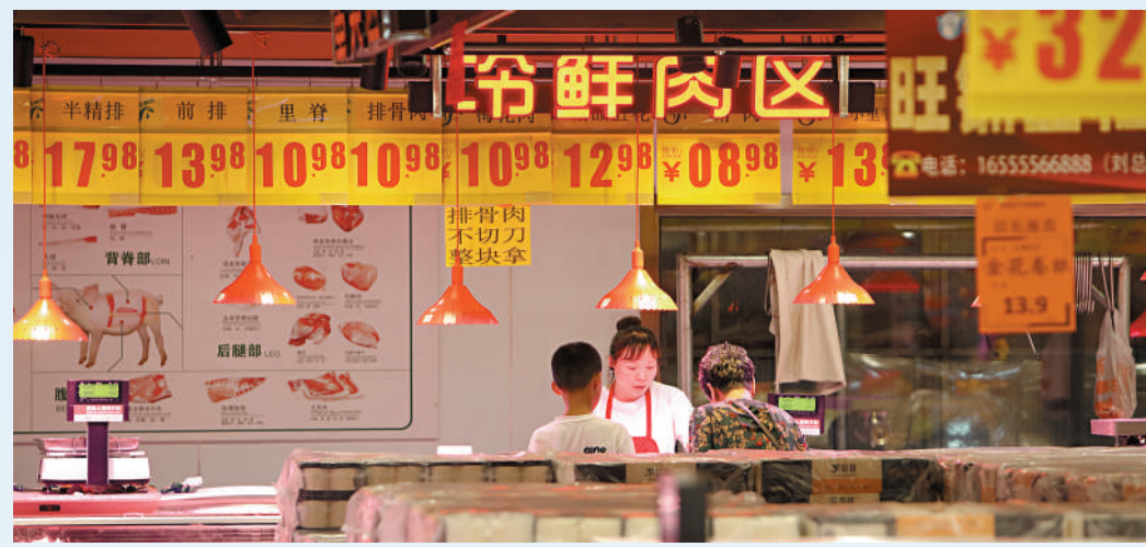
◀豬肉價格走低，是今年食品項通脹回落的主要原因。

四是為應對逆全球化、中美貿易摩擦等問題，繼續加大區域一體化合作。發揮區域全面經濟夥伴關係和「一帶一路」作用，加快形成中亞南亞西亞開放通道和打造內陸改革開放高地；穩步擴大規則、規則、管理、標準等制度型開放，推進自貿試驗區高質量發展，積極打造高能級開放平台；積極參與西部陸海新通道建設，充分發揮中歐班列西安集結中心作用，加快形成面向中亞南亞西亞國家的重要對外開放通道，在聯通國內國際雙循環中發揮更大作用；着力營造市場化、法治化、國際化一流營商環境，提高招商引資的質量和水平。