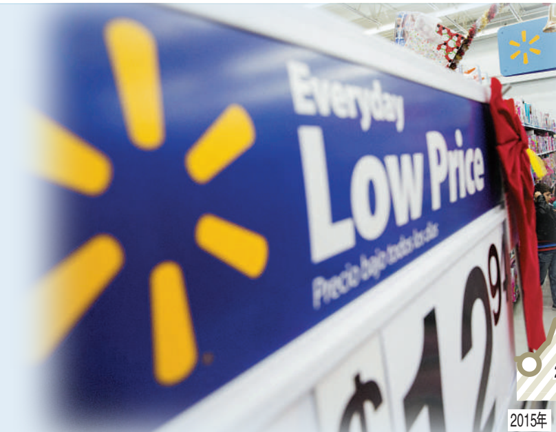
美國CPI今年數值(同比)