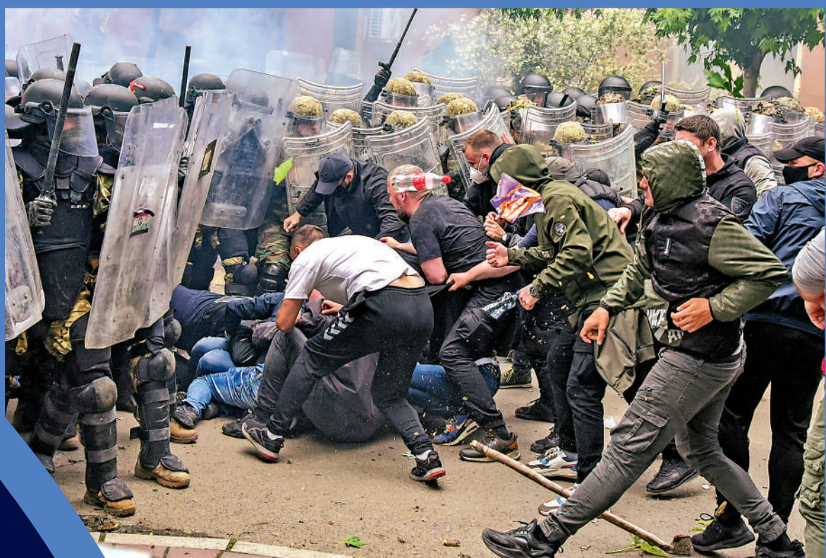
北約的干預導致科索沃地區長期動盪，圖為當地民眾5月與北約士兵發生衝突。

【大公報訊】綜合美聯社、BBC、新華社報道：俄烏衝突爆發後，北約開始了第六次東擴，在國際社會引起抗議和警惕。1949年，美國為對抗蘇聯，與歐洲盟友成立北約。42年後，蘇聯解體，冷戰結束，美國主導下的北約卻秉承過時的冷戰思維繼續搞集團對抗，把俄羅斯「逼到牆角」，引爆俄烏衝突；還把軍事干涉的黑手伸向東歐、中東、非洲等地區，讓多國陷入戰亂。有分析指出，北約實際上是美國維護霸權的工具。