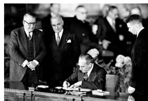
▲ 1949年，時任美國國務卿艾奇遜簽署《北大西洋公約》。

隨着美國將中國定義為「主要戰略競爭對手」，它也在推動北約把黑手伸向亞太。目前，北約已將澳洲、日本、韓國和新西蘭列為在亞太地區的合作夥伴。世界上越來越多人已經看清，美國主導下北約的種種霸權行徑，正是加劇世界動盪的根源。澳洲前總理基廷日前直言，北約在冷戰後繼續存在，本就否定了更廣泛的歐洲和平統一，如今又圖謀毒害亞洲地區。