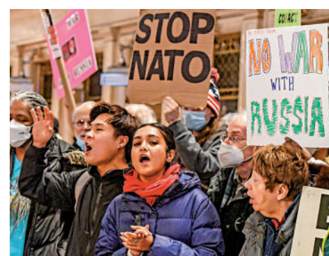
▲ 紐約去年2月舉行反北約和反戰示威。

美國一再為烏克蘭局勢火上澆油，促使俄烏衝突升級，目的之一就是加強歐洲與美國的政策捆綁，這樣自然就能消解冷戰結束後北約的「身份危機」。分析人士指出，北約秉承過時的冷戰思維和意識形態偏見，搞集團對抗，追求「絕對安全」，是逆歷史潮流而動，危害地區與世界和平穩定。