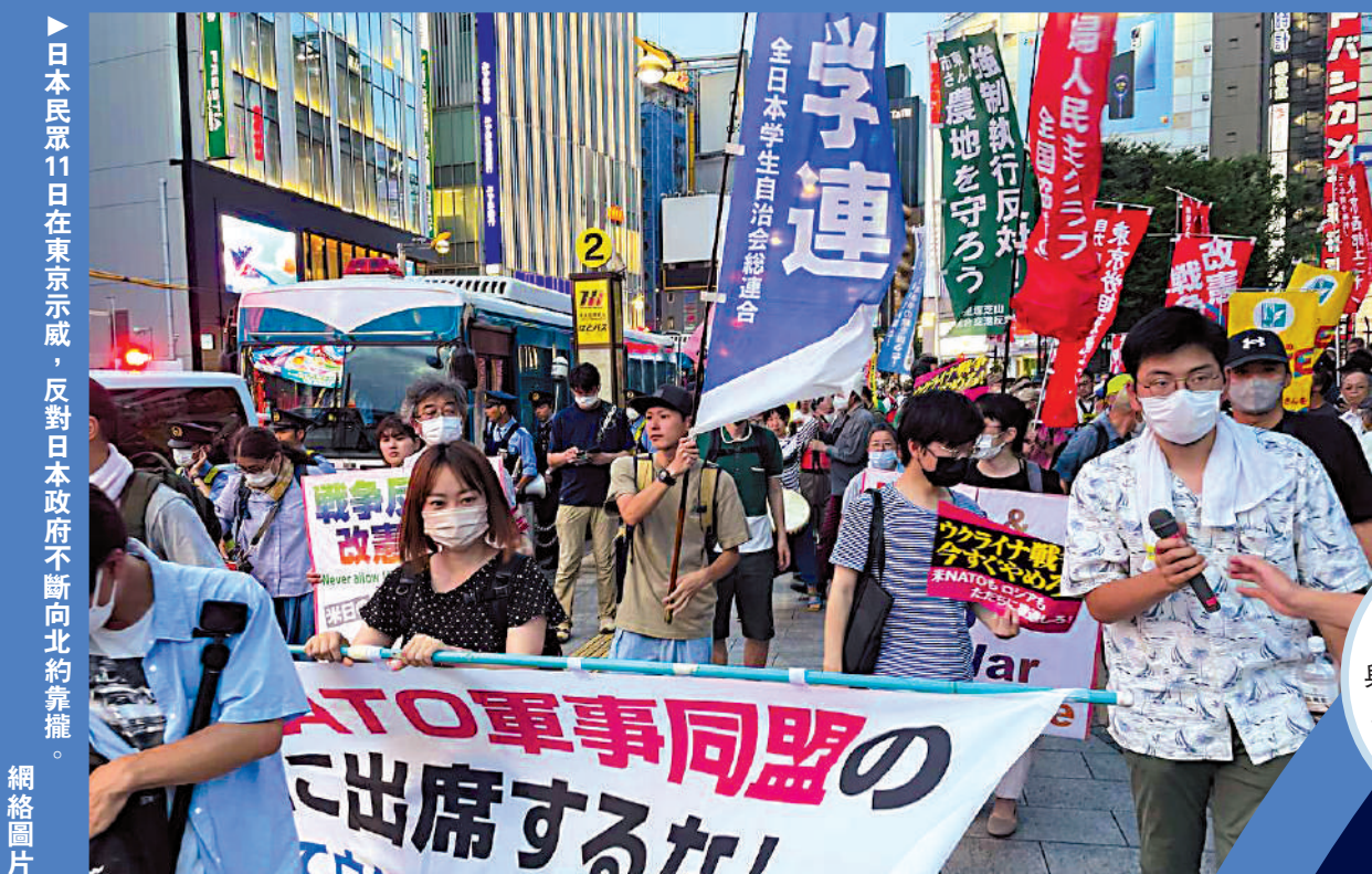
▶日本民眾11日在東京示威，反對日本政府不斷向北約靠攏。