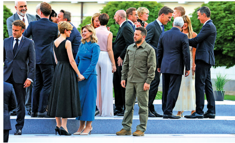
▲烏克蘭總統澤連斯基（綠衣）在大合照環節顯得形單影隻。

此外，峰會公報稱俄羅斯對北約成員國的安全及歐洲一大西洋地區的和平與穩定，「構成最嚴重的直接威脅」。俄羅斯總統新聞秘書佩斯科夫稱，北約是個發動挑釁和製造不穩定的「進攻性聯盟」。俄聯邦安全會議副主席梅德韋傑夫表示，烏克蘭可能永遠不會加入北約，而這個事實北約不敢大聲說出來。