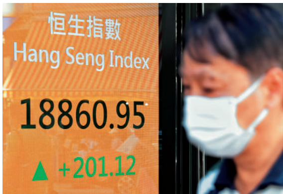
▲港股連升三日，昨日上漲201點，收報18860點。 中新社

18000點。 ATM獲發改委深入調研，阿里巴巴（09988）股價升1.2%，收報89.85元；騰訊（00700）股價升1.8%，報340元；美團（03690）股價升4.3%，收報127.3元。摩通表