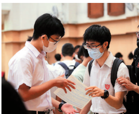
▲今屆文憑試將於下周三放榜，如天氣惡劣或會順延一天。資料圖片

考評局稱，若天文台在放榜日早上5時或之前，發出8號熱帶氣旋警告或黑色暴雨警告信號，