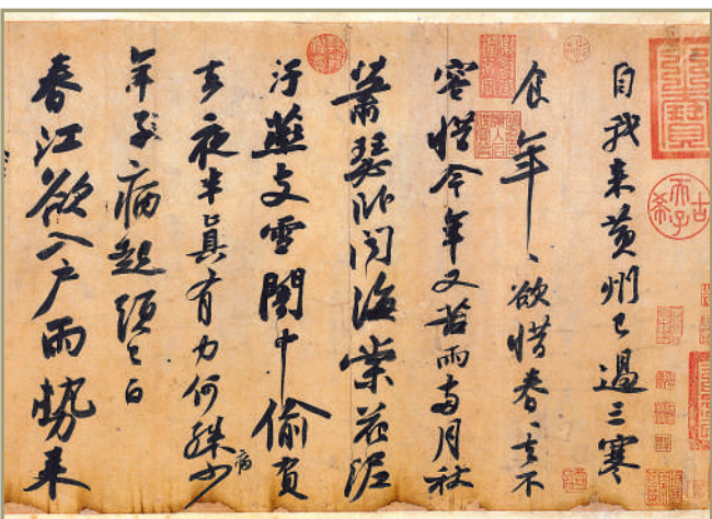
▲《黃州寒食詩帖》局部。

此帖文由兩首五言詩合成，共百餘字，從內容及筆意上亦分作前後兩段，前半段重敘述，採收勢，愈到後半段愈放達，抒情表意不拘形骸，氣韻流轉生動，墨色淋漓揮灑，可以想見蘇軾創作時情緒表達上的微妙變化。都說「字如其人」，字體風格和筆法與書寫人的性格契合；而觀此帖，再與蘇軾晚年創作的《洞庭春色賦》的典雅閒靜對照，不由感慨不止「字如其人」，更有「字如其時」，同一位書家，不同心境、不同景況下的創作，竟也如斯變化。