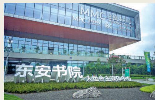
▲成都大運會主媒體中心大門。

據悉，主媒體中心將於7月25日進入24小時運行，在大運會期間持續運行30天，是運行時間最長的非競賽場館。