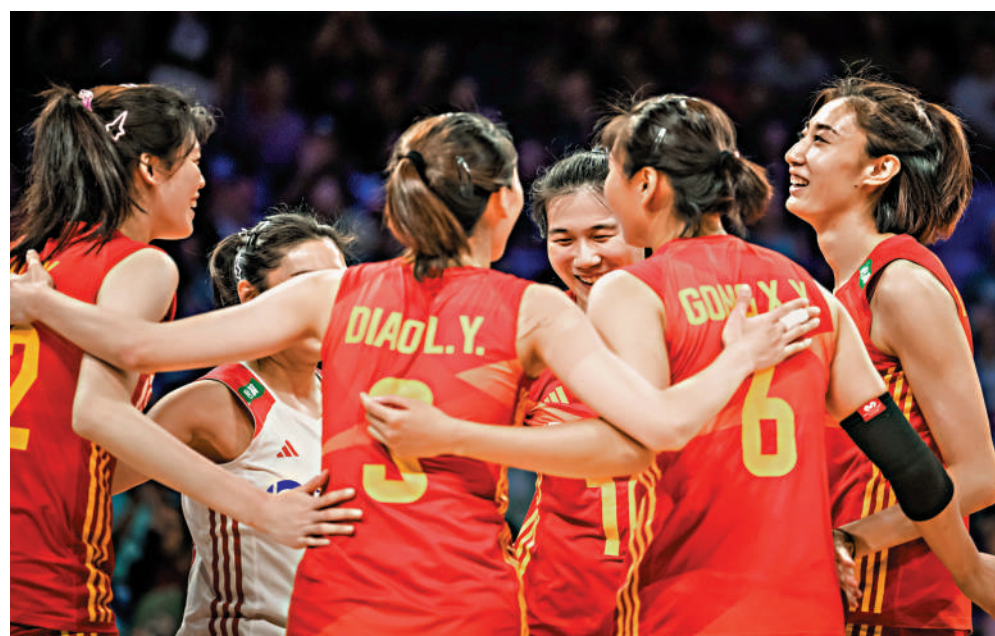
中國女排球員慶祝得分。

此仗，現場有不少中國女排球迷打氣，雙方首局爭持激烈，國家隊在17平手之際連取4分，並以25：21先拔頭籌。中國女排第2局落後3：5即連取5分反超前，之後一直領先以25：20再下一城。第3局，國家隊初段一度遙遙領先5：1，迫使對手要求暫停；巴西及後追上，憑着主力嘉比連取兩分反超前20：18，並以25：20追回一局。第4局，中國女排回勇，以25：23再贏一局，以3：1淘汰巴西。