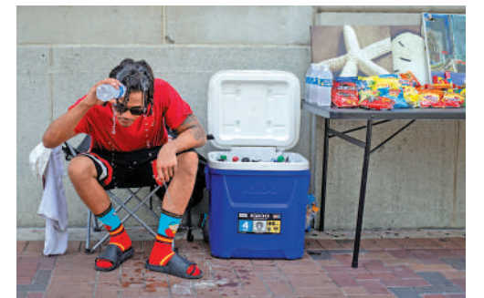
美國多地迎來高溫，頭上降溫。

另外，美國大部分地區持續遭受高溫天氣，從西岸加州伸延至佛羅里達州南部酷熱難耐，預計有估計約一億人受到高溫影響。不過，美國東北部佛蒙特州持續暴雨導致洪水氾濫，當地已宣布進入緊急狀態。