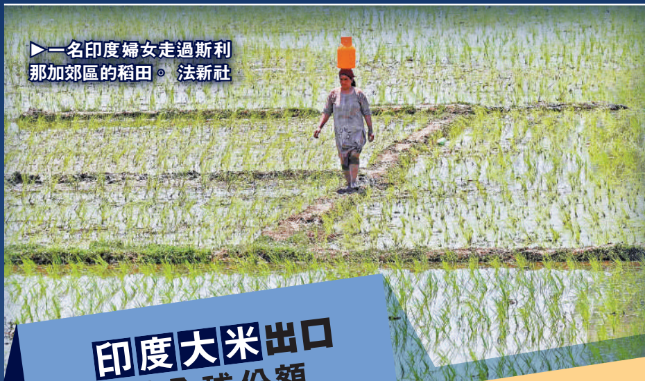
一名印度婦女走過斯利那加郊區的稻田。