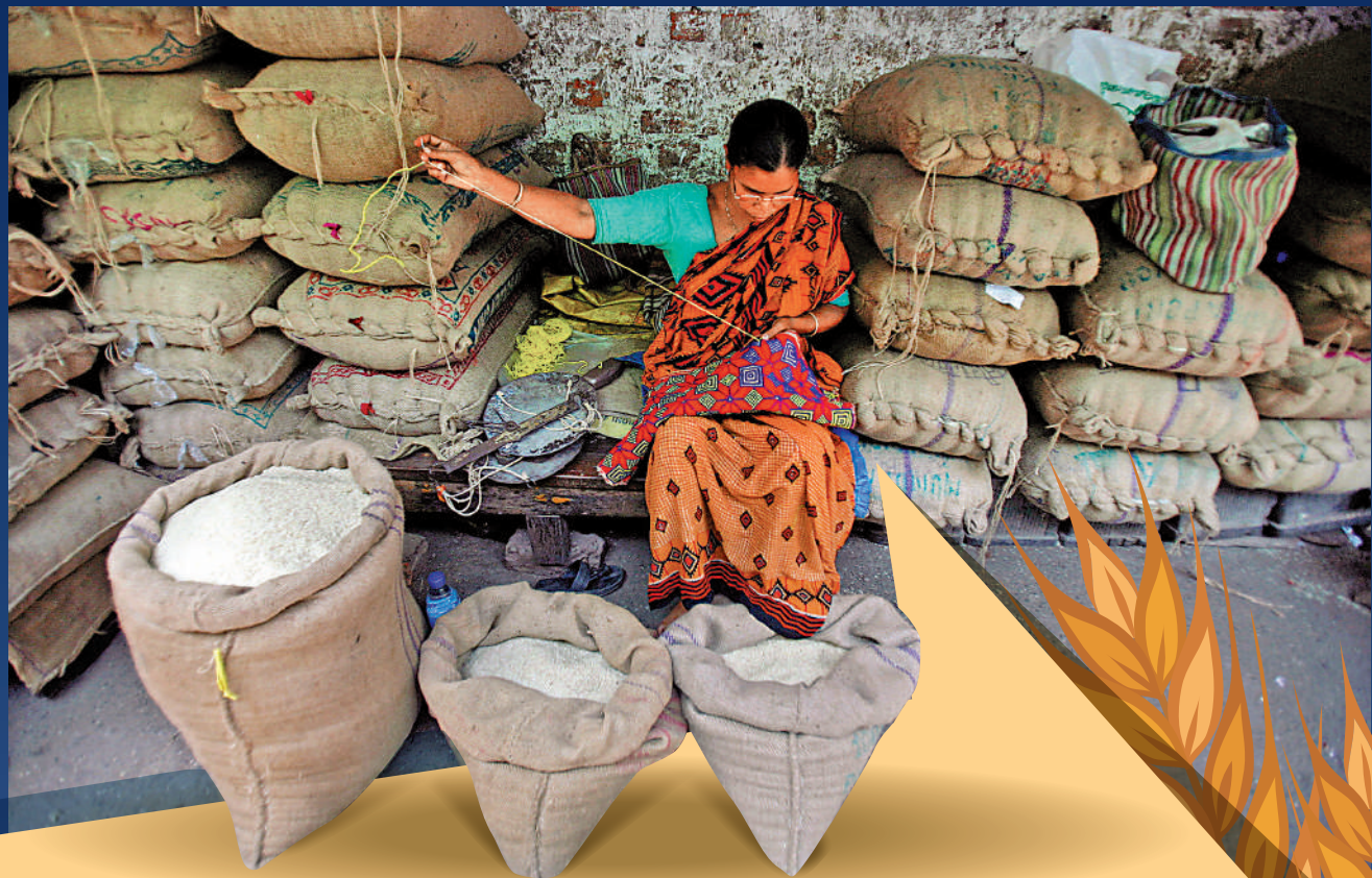
印度政府計劃出大米出口禁令，恐影響當地80%的大米。

【大公報訊】綜合彭博社、路透社、《金融時報》報道：全球最大的大米出口國印度正在考慮禁止出口大多數品種的大米，可能當地涉及80%的大米出口。目前，全球大米價格已升至11年來的最高水平，印度政府為抑制國內糧食通脹提出的這一舉措，可能會令本已高企的全球大米價格持續走高。另外，受厄爾尼諾現象影響，亞洲地區今年的水稻收成將進一步受到影響。