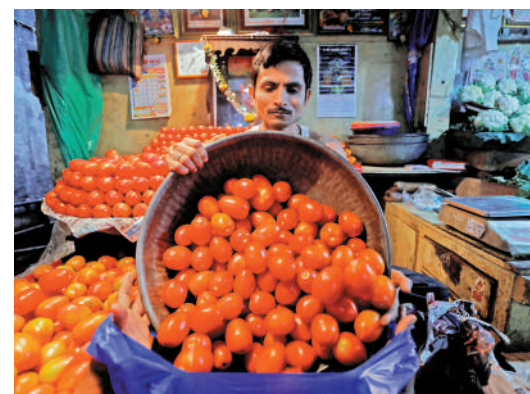
印度番茄價格近期急速飆升。