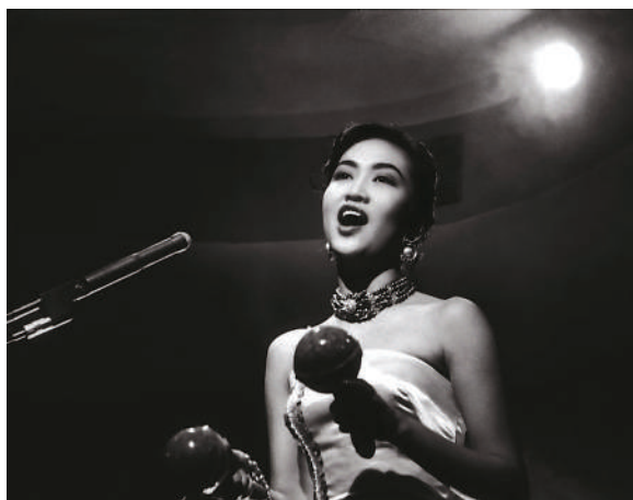
▲《野玫瑰之戀》（1960）4K修復版將於7月30日在香港文化中心大劇院首映。

影片為國語對白，設中英文字幕。票價45元，可於城市售票網（www.urbtix.hk）購買，電話購票請致電31661288。