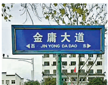
▲江西婺源縣城的「金庸大道」路牌。