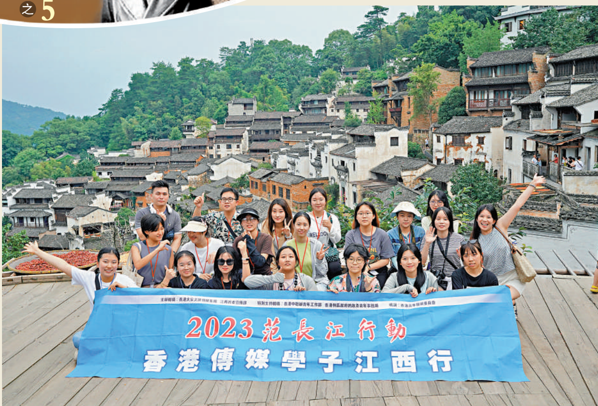
7月9日，2023「范長江行動——香港傳媒學子江西行」採訪團參訪婺源篁嶺古村。