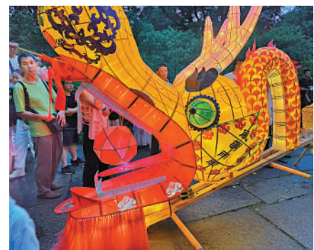
▲龍燈的龍頭有吉祥、多子多福的寓意。

便開始參與舞龍，「一開始抬着肯定很辛苦，因為很重，但是做久了就習慣了，也不覺得辛苦了。」曹師傅說，希望年輕人能多關注和參與舞龍燈，將這項非物質文化遺產傳承下去，展示中國傳統文化的獨特魅力。