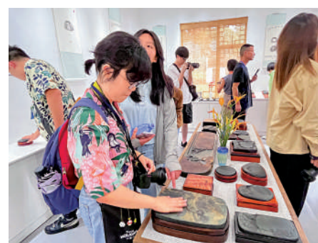
▲贛港學子在婺源縣參觀了大畈硯台博物館。大公報實習記者張依林攝