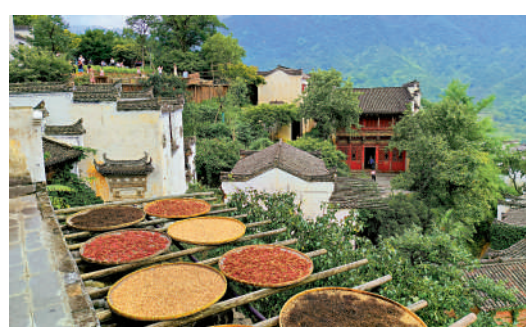
▲「曬秋」風俗成為篁嶺村獨特風景線。

1987年春，香港攝影大師陳復禮首次來到江西婺源，走村串巷，邊行邊攝，以一張名為「天上人間」的婺源油菜花照片斬獲國際攝影大賽金獎，使婺源美景揚名國際，成為中國攝影人的夢想之地，婺源「中國最美鄉村」的美譽也因此不脛而走，一直流傳至今。