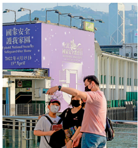
▲香港國安法實施以來，社會重回正軌，市民安居樂業。

特區政府會繼續堅定不移全面準確實施香港國安法，依法防範、制止和懲治危害國家安全的行為和活動，令香港可以穩步邁向「由治及興」。