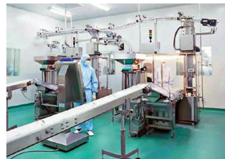
▲港澳藥品可在珠三角跨境委託生產，助力藥企降成本提產能。

【大公報訊】記者方俊明廣州報道：作為粵港澳大灣區合作中的首家化學藥物口服製劑跨境委託生產試點，香港聯邦製藥將持續擴產增能，在生物醫藥等方面進行創新突破，為推動粵港澳大灣區生物醫藥產業高質量發展作出貢獻。