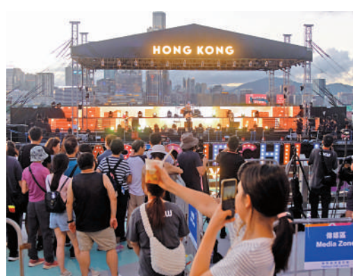
◀「樂聚維港嘉年華」在今明兩日再次上演。