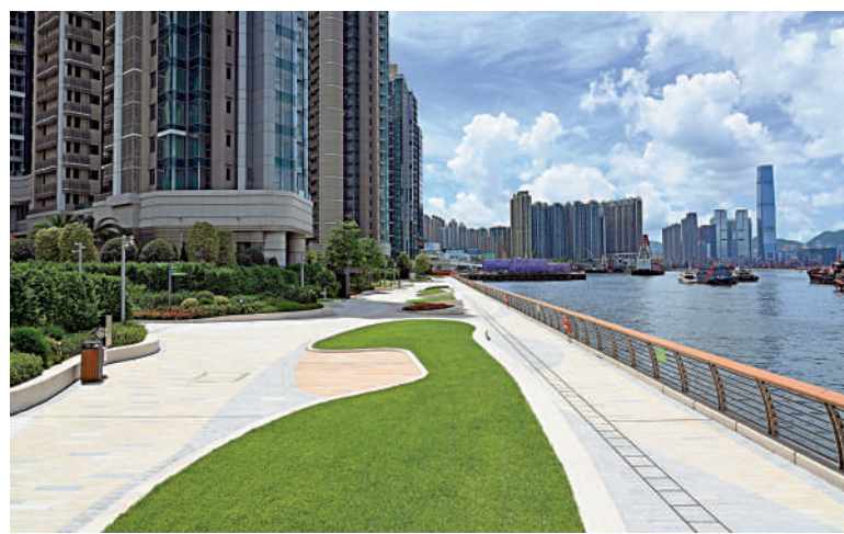
▲長沙灣海濱花園已經開放，是深水埗區內首個海濱公共休憩空間。