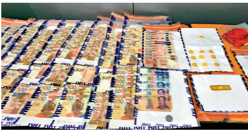
▲警方瓦解一個跨境洗黑錢集團，檢獲大批現金，拘捕包括主腦在內六人。

警方其後鎖定一個本地的洗黑錢集團，集團招攬家人及朋友開設大量個人銀行賬戶，透過有關戶口收取犯罪得益，再不斷互相過數以