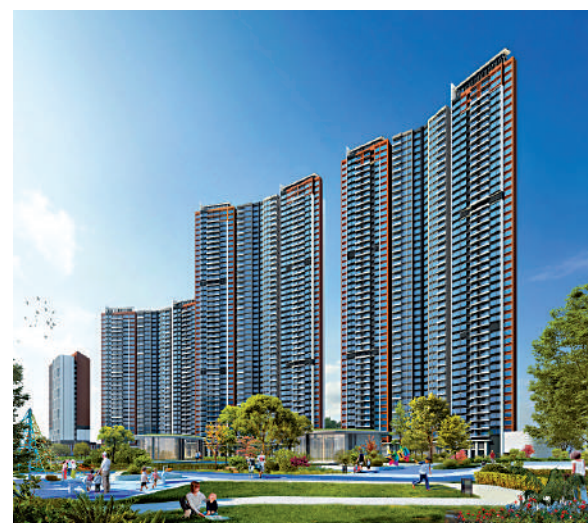
▲新世界星輝由15幢高層住宅組成，提供3145伙。

新世界星輝總建築面積45.5萬平米，提供3145伙，每平米均價1.9萬元（約2.08萬港元）。新近推出兩種全新戶型，其中87平米單位，三房兩廳間隔，雙露台設計，配備智能家居，四開間朝南，三間睡房與客廳一字排開，採光及視野極佳。另一個為111平米四房兩廳戶型，同樣四開間朝南，採光面長達12米，加上3米高的樓底，空間感充足。值得一提的是，精裝修交樓單位全屋採用國際大品牌，配置西門子廚房「三件套」（抽油煙機、燃氣灶頭和消毒櫃）、定製金屬門框、TOTO智能馬桶、智能門鎖等。