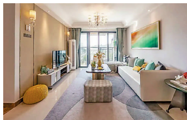
▲中新紫荊府在在單位間隔由兩房兩廳至四房兩廳。

資金充裕的買家可考慮122平米四房兩廳戶型，面積寬敞，空間開闊，採光充足，觀景露台將一線湖景盡收眼底；單位布局分明，四間睡房分置一旁，由走廊貫連，各個睡房戶型方正，睡床衣櫃擺位容易。