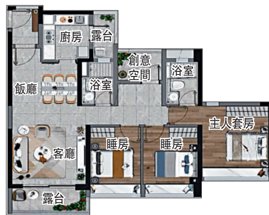
▲新世界星輝111平方米四房兩廳戶型圖。