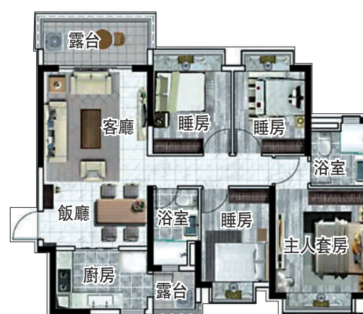
圖。▲中新紫荊府122平方米四房兩廳戶型。