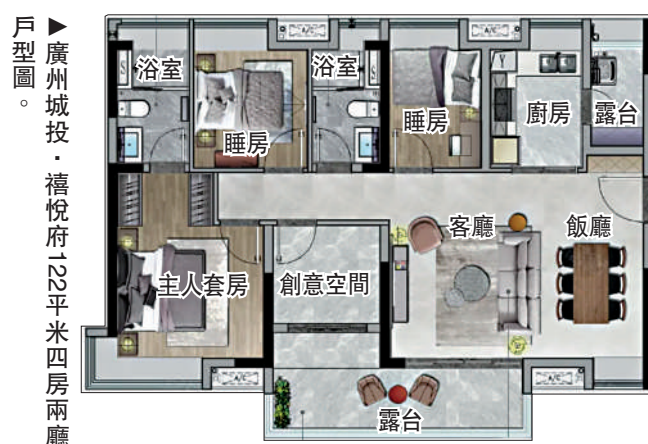
戶型圖。▲廣州城投·禧悅府122平方米四房兩廳。