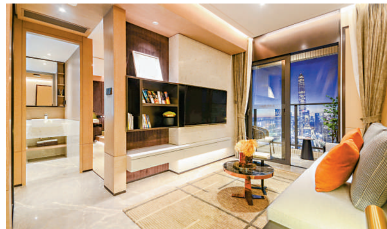
新世界星輝單位配備智能家居。