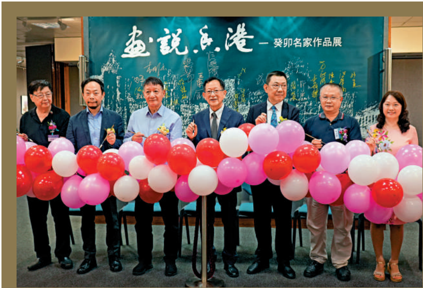
▲開幕典禮現場嘉賓合影。 大公報記者徐小惠攝