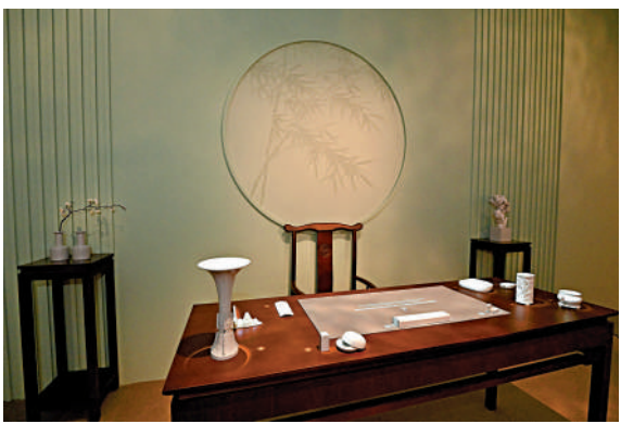
▲展覽現場。

冒險開拓展區主要展出在藝術創作上堅持自我，不在乎他人眼光的藝術家創作，該區展出畫家吳冠中、劉國松和王天德等人的作品，重在表現他們如何棄傳統筆墨，開拓現代中國水墨畫的全新面貌。