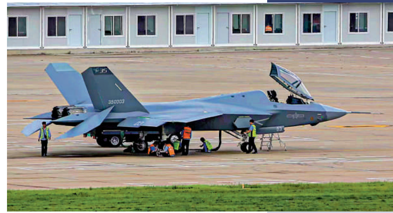
▲殲-35最初亮相時並未展示摺翼狀態。

在福建艦未來的作戰體系中，殲-35隱身戰機主要用於高速突防，隱蔽攻擊，奪取制空權。殲-15T則承擔火力支援。空警-600預警機為航母編隊提供信息預警、攻擊引導。而攻擊-11無人機艦載版可以作為僚機協助殲-35作戰，加強火力打擊烈度。