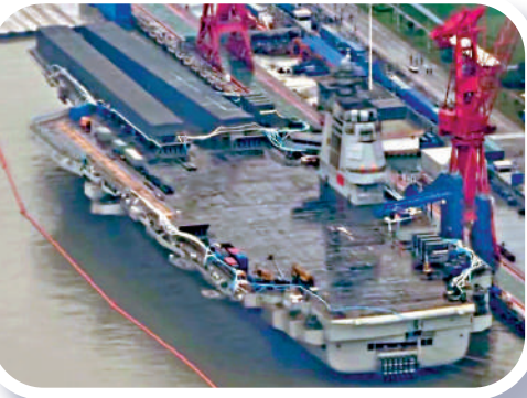
▼最新曝光相片顯示，福建艦斜角甲板上三號電磁彈射軌道的工棚已經拆除。

福建艦 長度：320米 排水量：85000噸 動力：常規 飛機升降機：2台 彈射器：3台電磁彈射器 固定翼載機：殲-35、殲-15T、空警-600 以上資料為外界所推測