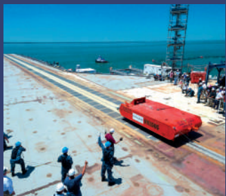
▲美軍福特艦的電彈系統在2015開始靜載荷測試。

• 此階段會彈射與艦載機等重的彈射車，以驗證彈射器及其每個部件是否正常工作。以美軍經驗，此階段約在空載測試一個月後展開。