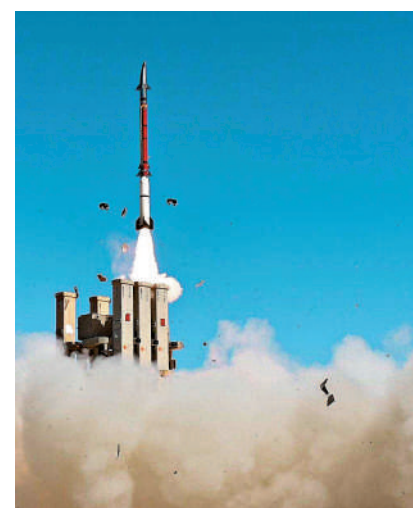
中升空。▶「大衛彈弓」防空系統導彈在近日測試

但此次最新曝光的「魔改版」，在瞄準鏡上方加裝了黃色的新型輔助夜視儀。在黑暗中射擊時，會向前方發出肉眼不可見的光束，對目標進行「補光」，射手通過夜視鏡可以更清晰觀察目標，從而提高射擊的精確度。