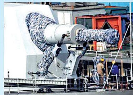
▲此前曝光的中國在研電磁炮。

艦載機起飛效率，讓作戰的反應速度最大化，幾十秒就可彈射一架戰機。而且適應性好、易於維護，可快速切換模式，來彈射不同體量的艦載機，這是蒸汽式彈射所不具備的。電磁彈射系統順利過關，將是中國航母乃至整個海軍發展的重要里程碑。