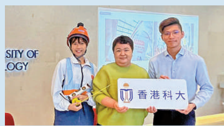
▲科大支援學生在疫情後重投就業市場以及明確職業規劃。大公報實習記者魏溶攝

【大公報訊】實習記者魏溶報導：香港科技大學就業中心於7月12日發布學生就業情況說明，指科大本科畢業生2022年月收入較2021年顯著提升10.4%。科大就業中心高級學習發展培訓導師蕭慧思表示，為支援學生在疫情後重投就業市場及明確職業規劃，提供額外30%的小組個性化學習項目；亦提供職業技能提升系列課程及「設計人生」學分課程。另外，科大亦通過線上招聘系統為學生提供5500個工作崗位及3700個實習機會。