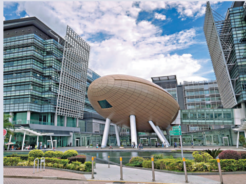
▲孫東指要用好現有土地資源，科學園除了沙田本部，還打算將三大園區發展成主題園區，方便企業在裏面開闢生產基地。

新一屆特區政府班子上任一年，在過去一年裏，創科局除了推出《香港創新科技發展藍圖》，在加強中游成果轉化、加強創科基建等方面都著墨不少。孫東局長介紹，創科局未來將繼續加強上中下游的協調發展，上游的基礎科研向來是香港的優勢所在，政府亦會繼續加強；中游方面，創科局馬上要推出「產學研1+計劃」，「現在各間大學正摩拳擦掌，把大學的優秀成果轉化到實際可應用。」