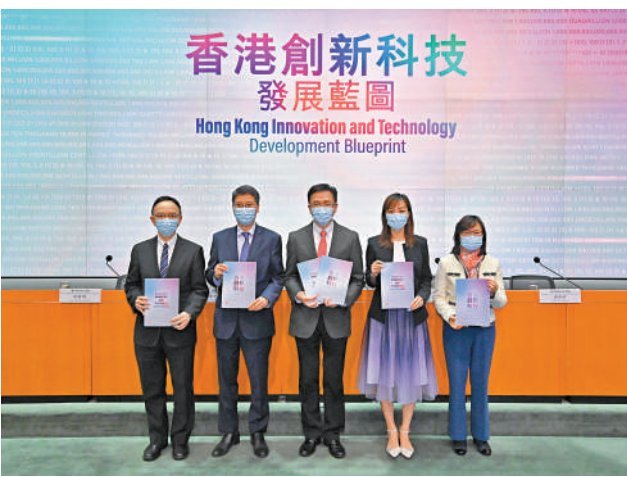
▲創科局推出《香港創新科技發展藍圖》，為特區創科政策做好布局。

不過，在搶企業特別是龍頭企業上還有不少困難。孫東說，第一是土地資源的問題；第二，還需要考慮具體的企業支援政策。「我5月份去德國時，正好德國在補貼300億給一些新建的產業；美國也有過千億