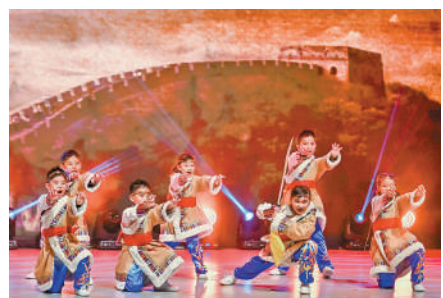
▲福建中學附屬學校學生題為「匈奴入侵」的武術表演。

生，教授有關中國傳統藝術課程，讓學生及弱勢群體透過不同表演形式，感受中華文化。計劃會在今學年結束。