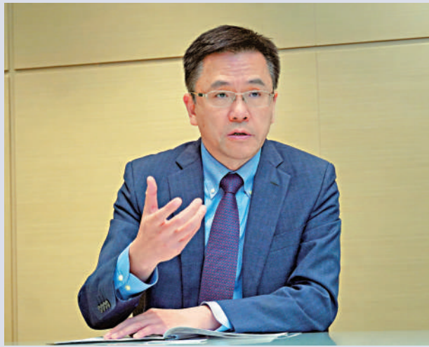
▲創新科技及工業局局長孫東接受《大公報》專訪表示，香港必須做好配套，吸引創科龍頭企業來港。