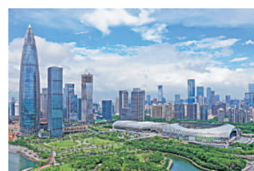
▲從科研投入角度看，香港不及深圳等城市。

談及科研經費，孫東表示，創新科技局成立以來投資了兩千多億，大部分用於基建。他介紹，真正用於前沿科學成果平均每年大概是兩百多億，相對於本地GDP的比率不到1%，低於全國平均值（2.8%），更加遠不到深圳和大灣區部分地區的4%、5%。孫東說：「從科研投入來講，我們還不能算是真正的創新科技中心。」孫東強調，從政府角度來講，不能自滿，很多工作還要繼續努力。