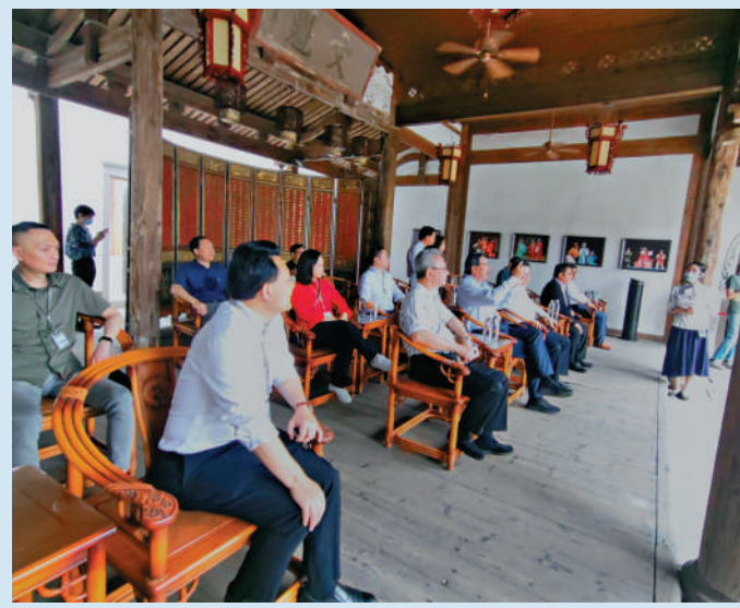
▲議員在「水榭戲台」細心聆聽專人講解保育工作。