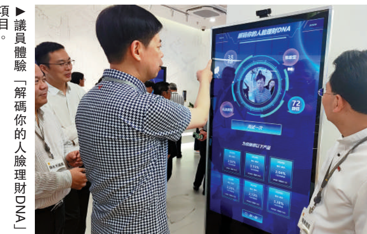
▶議員體驗「解碼你的人臉理財DNA」項目。