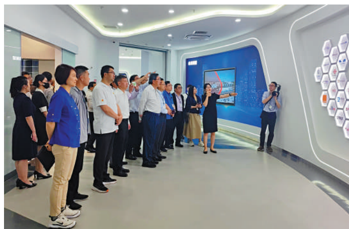
◀考察團到訪星網銳捷，了解公司在智慧產業和數字經濟領域的創新成果。