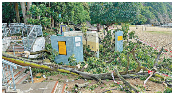
▲南灣泳灘一棵樹被強風吹倒，壓傷一名外籍女子。

至於打風水浸黑點，杏花邨在每一座大堂門口均貼上膠紙，亦在電機房安裝擋水板。鯉魚門一帶