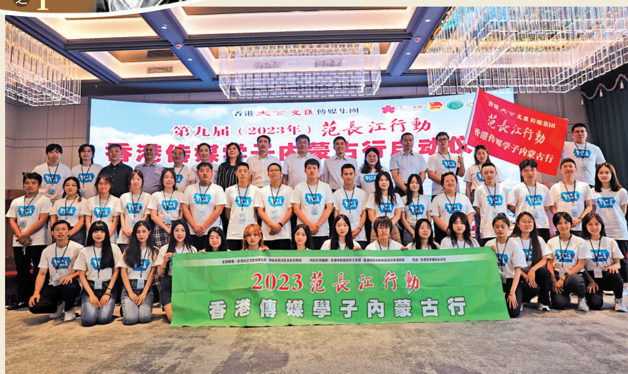
▲2023年范長江行動——香港傳媒學子內蒙古行昨日在呼和浩特舉行啟動儀式。