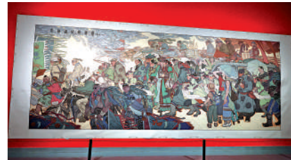
▲中國女畫家要紅宇作品《走向盛世那達慕》。