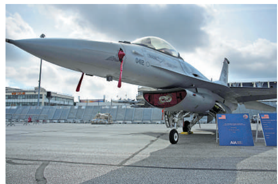
▲歐洲或將於8月開始培訓烏克蘭機師駕駛F-16戰機。

式開始。據CNN報道，沙利文的最新表態說明拜登政府的立場發生轉變。拜登早前曾說，他不認為烏克蘭需要F-16戰機。CNN稱，目前俄羅斯仍掌握制空權，烏軍6月初發動的「大反攻」進展不順，主要原因之一就是被俄羅斯空中力量壓制。