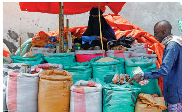
▲烏克蘭糧食出口目的地包括索馬里等貧困國家。

米亞官員隨後宣布，大橋的鐵路交通已恢復，鐵軌沒有受損。克里米亞大橋去年10月曾遭到襲擊，公路橋和鐵路橋均受損，直到今年2月才完全恢復交通。本月稍早，烏當局宣布對去年的襲擊負責。扎哈羅娃17日指控美英情報部門參與了新的襲擊行動。