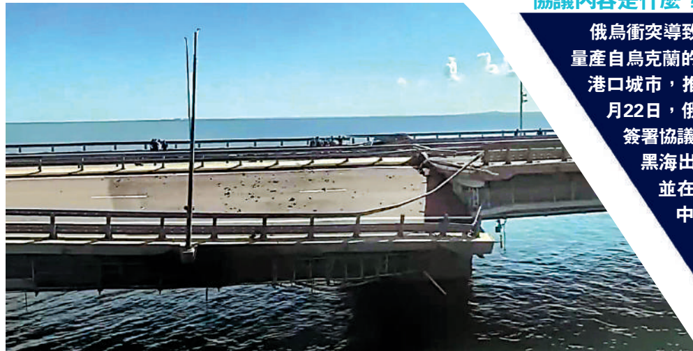
▲克里米亞大橋疑遭烏克蘭無人艇襲擊。

近期美歐遭遇極端高溫和乾旱，農產品預期產量下降，黑海運糧協議中止的消息進一步刺激糧價上漲。據路透社報道，芝加哥期貨交易所玉米價格17日升至兩周以來最高點，小麥價格一度上漲4%。