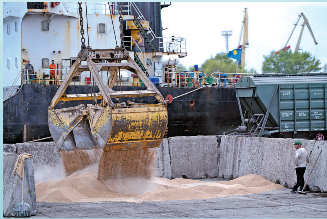
▲黑海運糧協議生效期間，烏克蘭從黑海港口出口了逾3200萬噸穀物和其他食品。