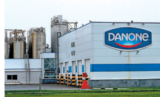
▲俄羅斯政府16日宣布接管達能公司在俄子公司。資料圖片

俄烏衝突爆發後，西方國家不僅凍結俄央行海外資金，還沒收了大量俄羅斯個人和企業的資產。今年2月，美國司法部長加蘭稱，他批准將俄商人被沒收的資產轉交給烏克蘭，用於烏方重建工作。