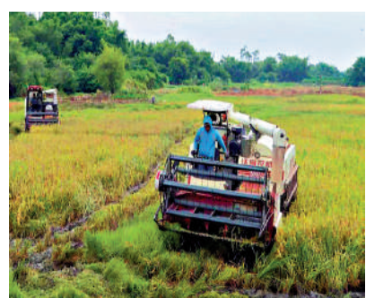
▲颱風「泰利」來襲前，廣東多地搶收農作物。

做好準備 今年第4號颱風「泰利」來襲，珠三角多地農田紛紛搶收水稻、農作物。「颱風要來了！得趕緊收割了。」