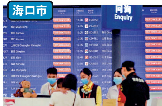
▲「泰利」吹襲下，海口美蘭國際機場進出港航班全部取消。有旅客在問詢台了解航班信息。 中通社

廣之旅方面表示，跨省遊方面，受航班變更影響，16至17日飛返廣州的部分航班取消，原計劃在該兩天回程的部分旅行團出現返程延遲的情況；該社已第一時間將具體情況向受影響遊客說明，並妥善安排延遲返程遊客在當地的食宿。省內遊方面，17至18日出發的陽江方向、珠海方向團隊已經取消；而在途遊客目前均在安全區域活動。