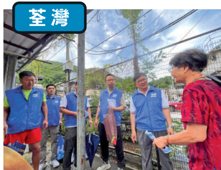
▲荃灣區關愛隊成員探訪深井低窪地區寮屋居民。

早在颱風接近本港前夕，隊員們便已積極地投入到支援行動中，向居民發放最新風暴消息、探訪區內居民，提醒他們做好防風措施。其中，南區赤石關愛隊隊員前往石澳派發沙袋給居民，幫助他們防止水災的發生。荃灣區汀深關愛隊及荃灣郊區關愛隊探訪了深井低窪地區寮屋居民提醒住戶密切關注最新天