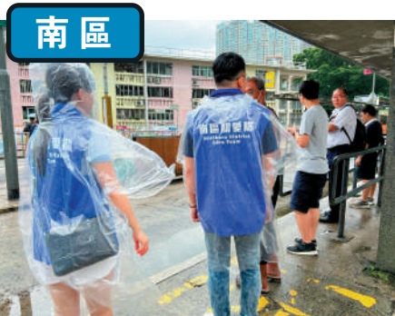
▲南區關愛隊隊員在華富邨巴士站，提醒市民做好防風措施。

天文台懸掛8號風球後，兩區關愛隊在區內庇護中心通宵當值，為入住市民提供物資同解答疑難。關愛隊亦在社